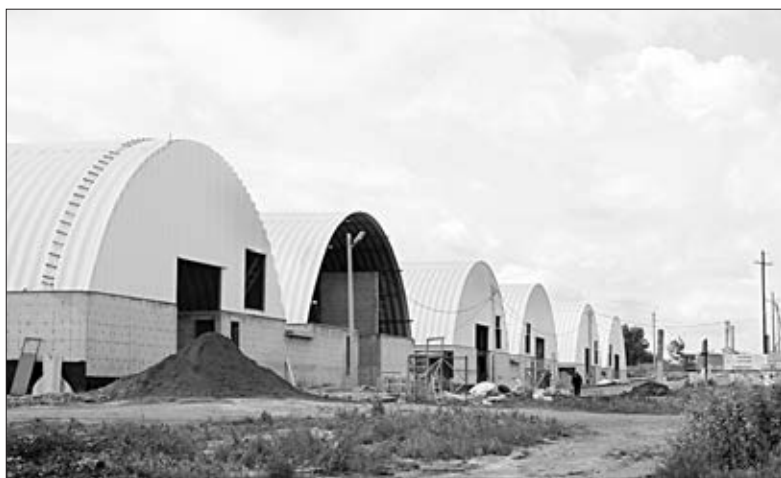
СТРОИТЕЛЬСТВО СОВРЕМЕННЫХ КАРТОФЕЛЕХРАНИЛИЩ.

и коррекционная специализированная школа. Везде с любовью и старательно ухаживают за своей территорией, разводят огородное хозяйство, активно участвуют в общем благоустройстве.