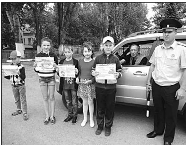
УЧАСТНИКИ АКЦИИ «НЕ ГОНИТЕ, ВОДИТЕЛИ! ВЫ ВЕДЬ ТОЖЕ РОДИТЕЛИ!» В МАЛОЙ БОЕВКЕ.

Сами мальчишки и девчонки знают, что улицу надо пересекать по пешеходному переходу, не гонять на велосипедах по трассам.