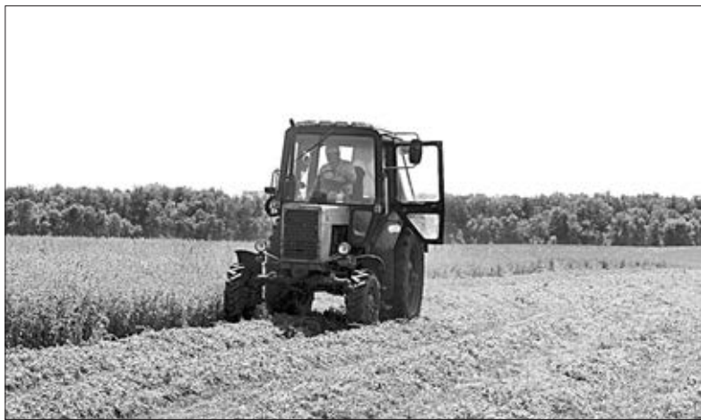
ИДЕТ УБОРКА МНОГОЛЕТНИХ ТРАВ.