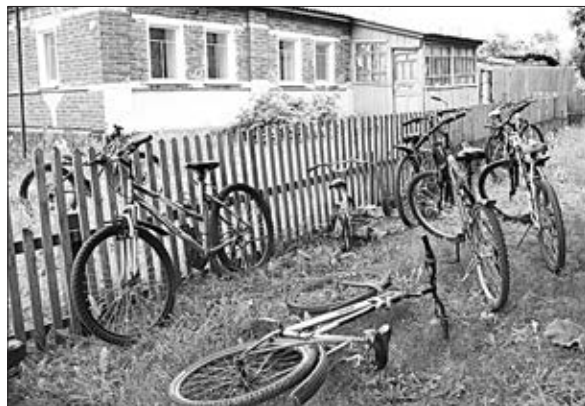
ВЕЛОСИПЕДЫ — СРЕДСТВО ПЕРЕДВИЖЕНИЯ, КАК СЛЕДСТВИЕ — ЗДОРОВЬЕ, ДОЛГОЛЕТИЕ.