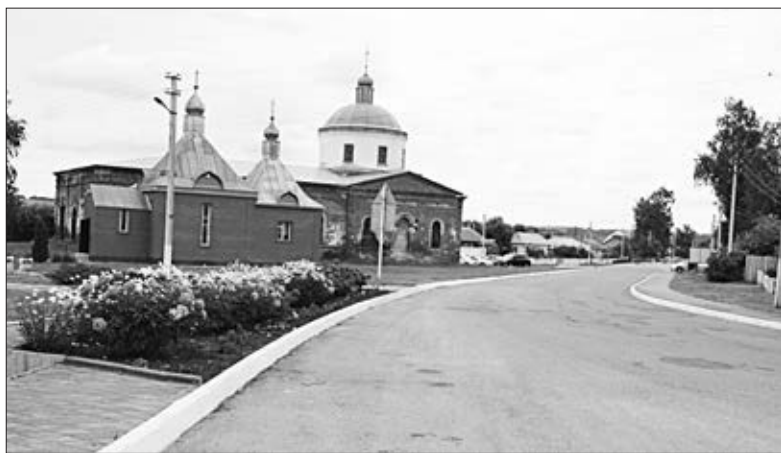
ЧЕРКАССЫ — ТЕРРИТОРИЯ ЧИСТОТЫ И ПОРЯДКА.