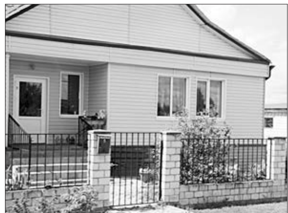
ДОМ НА ДЕРЕВЕНСКОЙ УЛИЦЕ.

По итогам соревнований места распределились следующим образом: первое — у команды Лавского сельсовета; второе — у спортсменок Архангельского поселения; третье досталось представителям Нижневоргольского поселения.