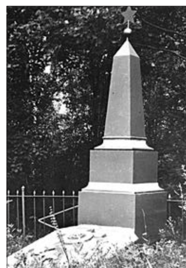
ТАКИМ БЫЛ ПАМЯТНИК ГЕРОЯМ ВЕЛИКОЙ ОТЕЧЕСТВЕННОЙ ДО РЕКОНСТРУКЦИИ.