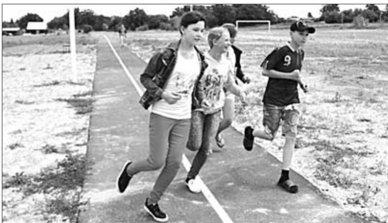
ГОТОВУЮ ВЕЛОДОРОЖКУ ОПРОБОВАЛИ ПЕРВЫМИ БЕГУНЫ ИЗ ЧЕРКАССКОЙ ШКОЛЫ.

На новом стадионе в селе Черкасссы, кстати, велодорожка уже вовсю эксплуатируется ребятей. Но предстоит еще немало сделать для того, чтобы передвижение было не только безопасным, но и комфортным.