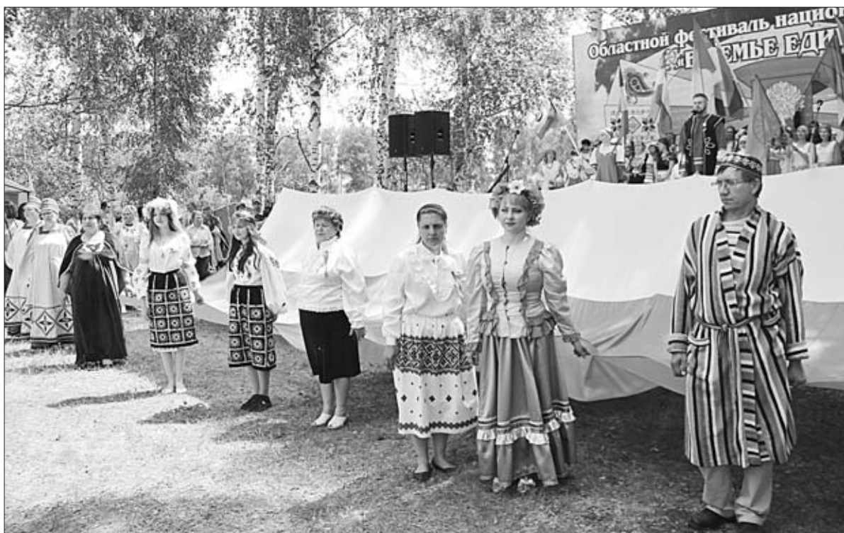
МНОГОМЕТРОВОЕ ПОЛОТНИЩЕ НЕСЛИ ПРЕДСТАВИТЕЛИ МНОГИХ НАРОДНОСТЕЙ, НАСЕЛЯЮЩИХ ЕЛЕЦКУЮ ЗЕМЛЮ.