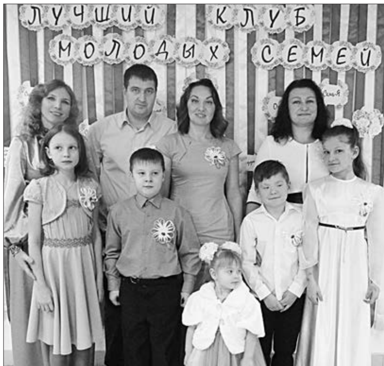
Члены семейного клуба «Семь — Я» Казинского центра культуры и досуга.