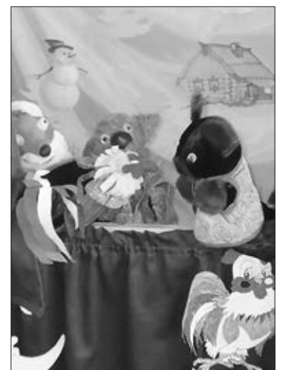
Куклы, созданные мастерицами клуба «Елецкие казаки».