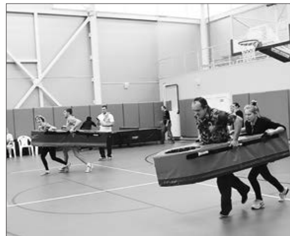
Семья Кашиных против семьи Садовых: кто быстрее?