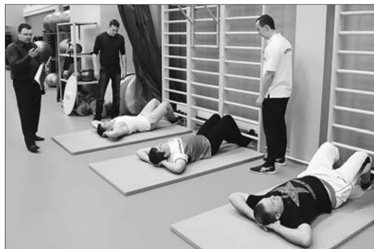
С упражнением «Качание пресса» все богатыри справились легко.