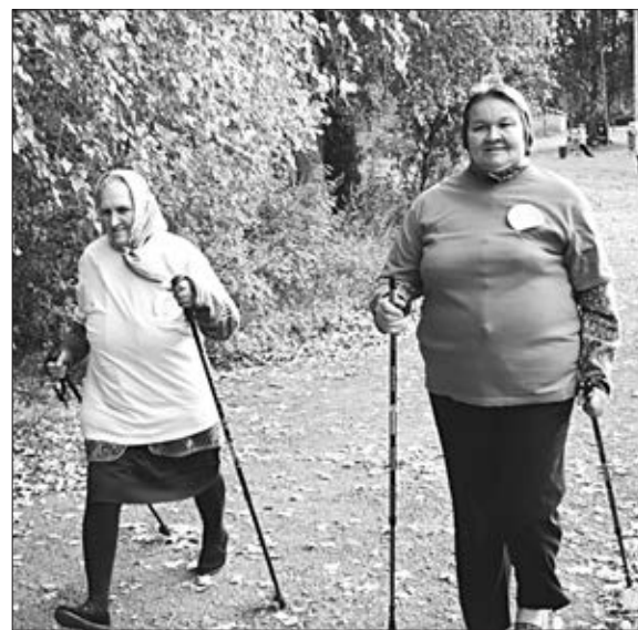
Скандинавская ходьба прибавляет сил.