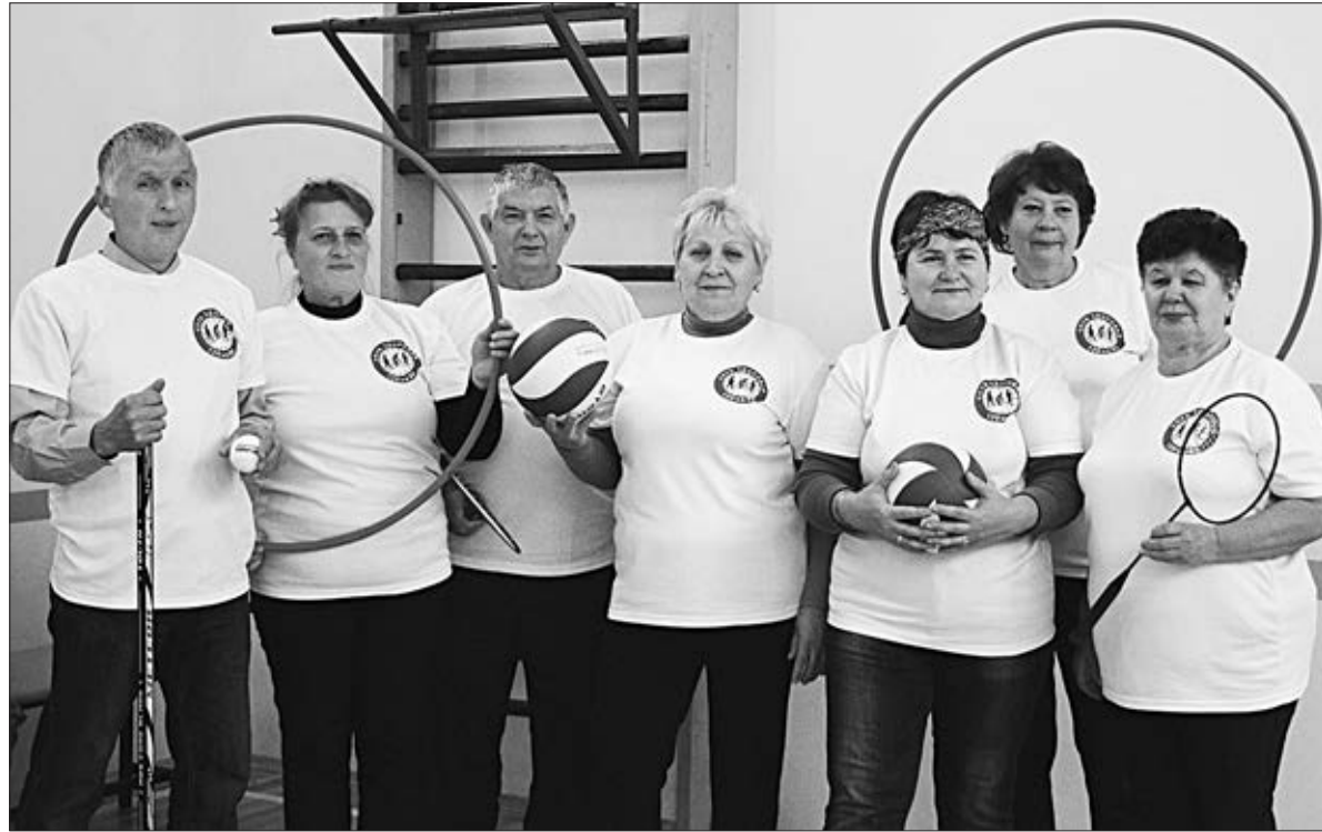
Дружная команда «120 на 80» Малообоевского поселения стала победителем районной параспартакиады.