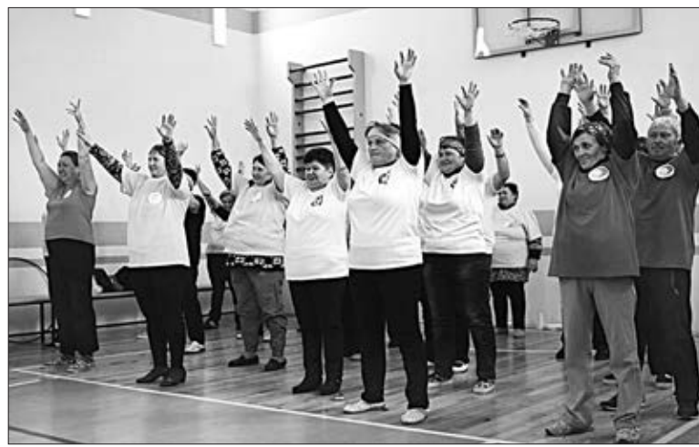
«Зарядка с чемпионом» — разминка перед основными состязаниями.

Дипломы, подарки, медали клубы здоровья увезут с собой на память о