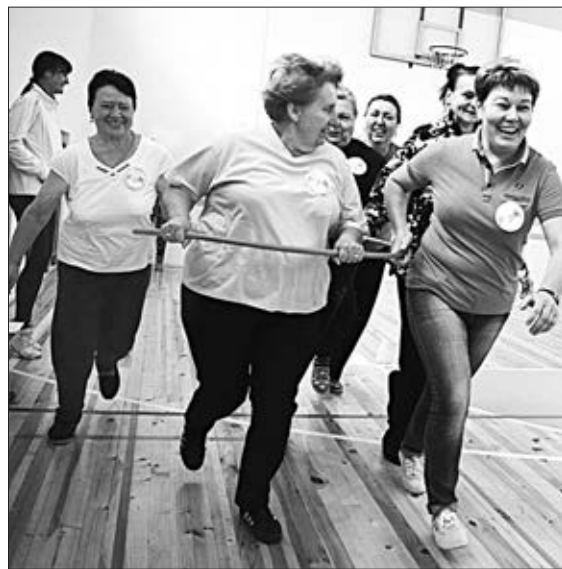
«Территория здоровья»: вперед к победе!

Больше фотографий на сайте www.krai-rodnoi.ru .