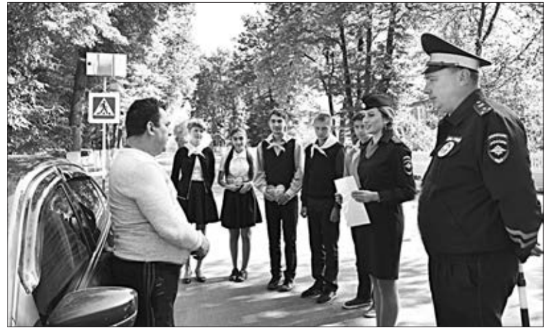
«Лайк» водителю за безопасное вождение от добровольцев школы поселка Ключ жизни и сотрудников подразделения ГИБДД Елецкого района.