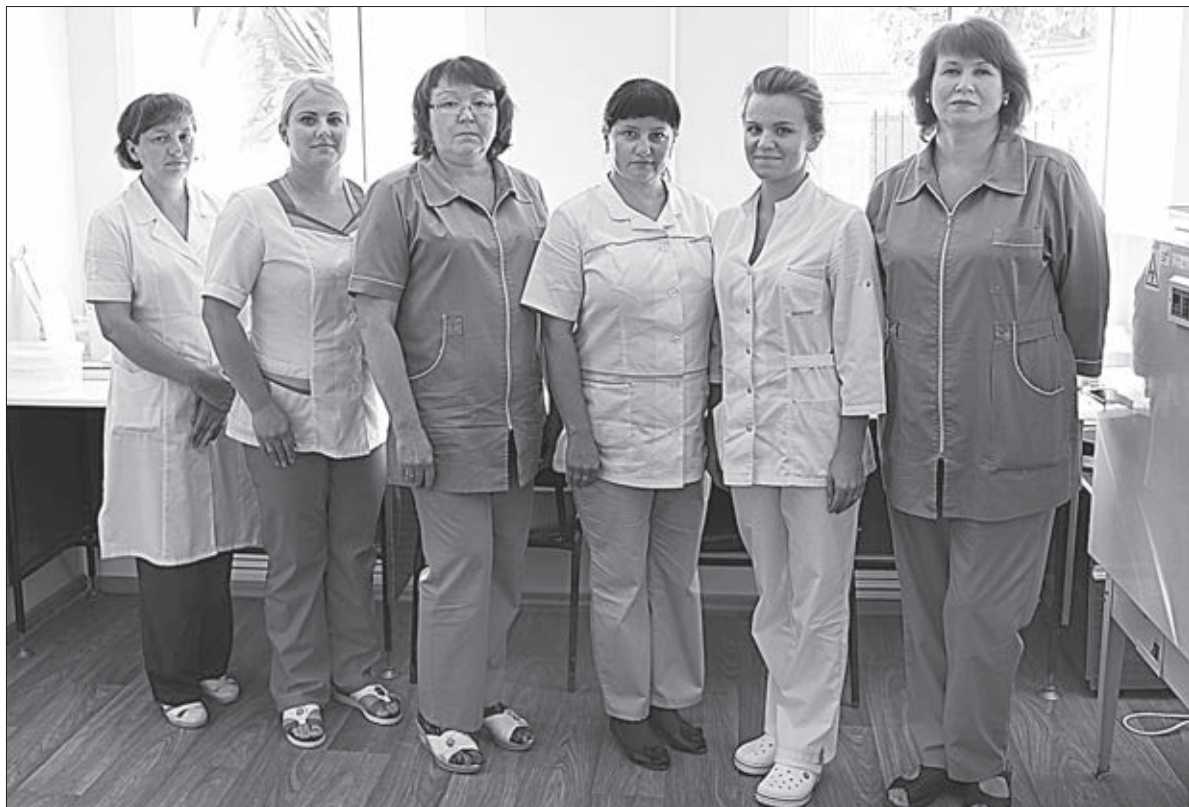
Сотрудницы бактериологической лаборатории филиала Центра гигиены и эпидемиологии.

Исследования воды, воздуха, почвы, продуктов питания и даже строительных материалов — это та деятельность, которую проводит филиал Центра гигиены и эпидемиологии.