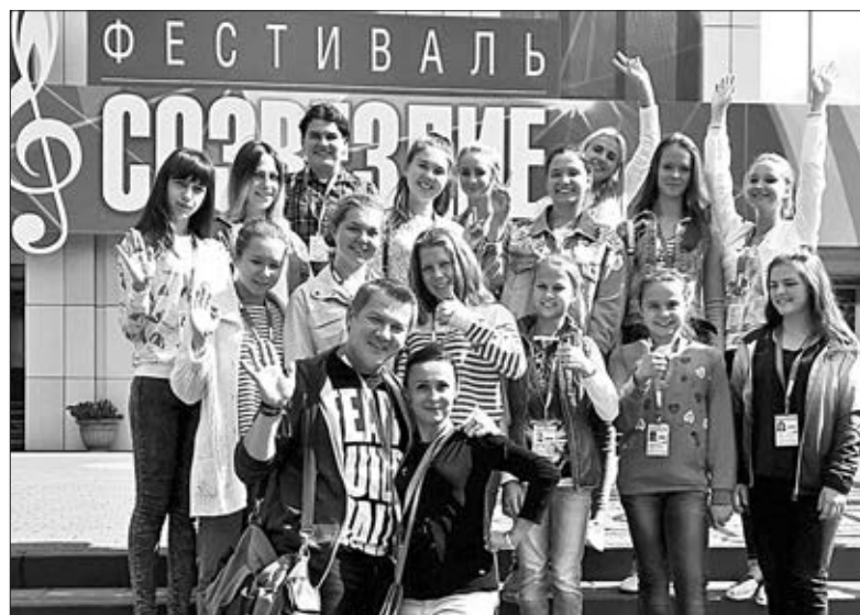
Танцевальный коллектив «Перекресток» и вокальный ансамбль «Соловушка» с наградами фестиваля.

«Соловушка» исполнила русский народную песню «Зеленая рожица»