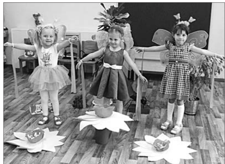
Занимательный танец «Мед мы собираем».