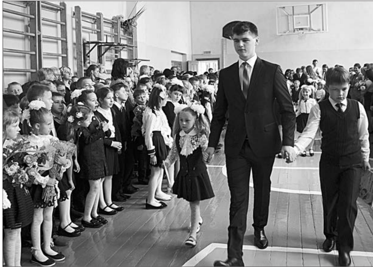
Первоклашки школы поселка Солидарность вместе с выпускниками отправляются в Страну знаний.