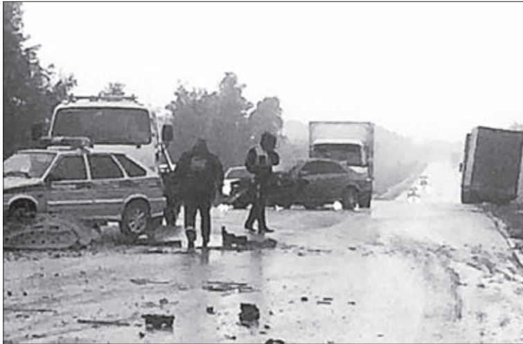
Из-за аварии движение по трассе было затруднено.