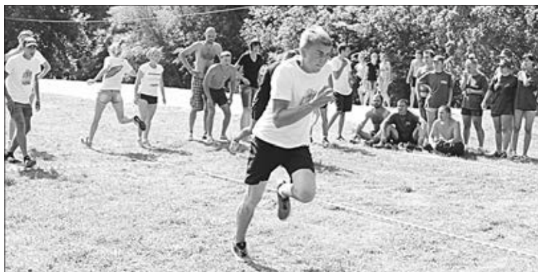
Эстафета — серьезное испытание для участников форума.

Больше фотографий — на сайте нашей газеты www.krai-rodnoi.ru