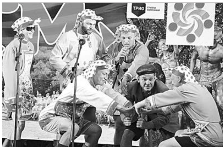
На сцене: этап «Избирательная кухня» — команда Архангельского поселения.