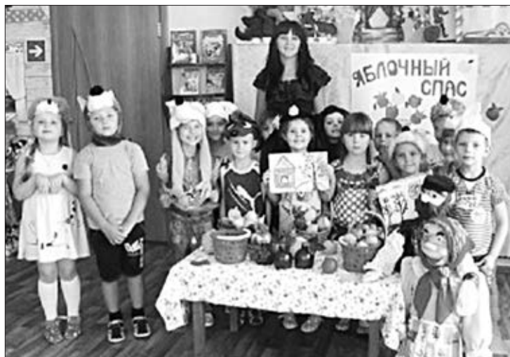
Участники праздника в детском саду поселка Газопровод.