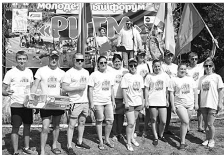
Команда-победительница из Нижневоргольского поселения.