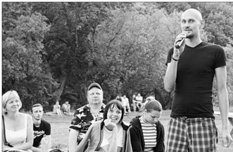
Диалоги с властью: свой вопрос.