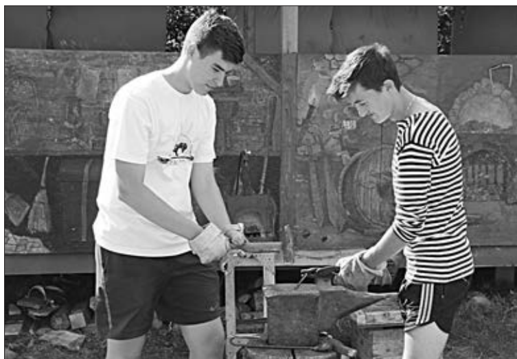
Мастер-класс по кузнечному делу — это интересно.