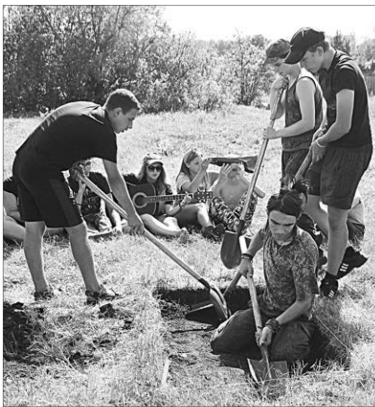
Один из этапов соревнований: раскопки.