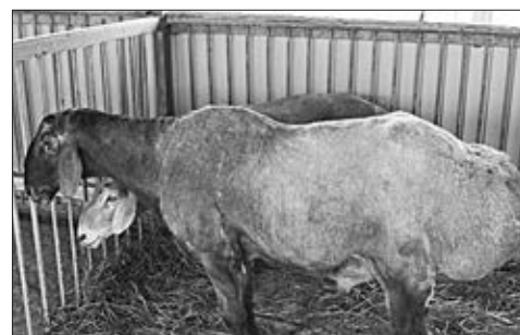
«Золото» взяла эдельбаевская порода.