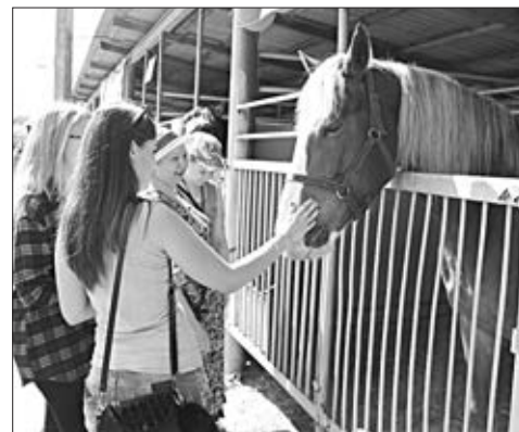
Красавцы кони благосклонны к посетителям.