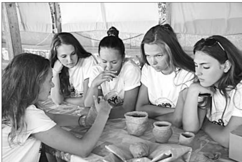
Участницы конкурса упражняются в лепке из глины.