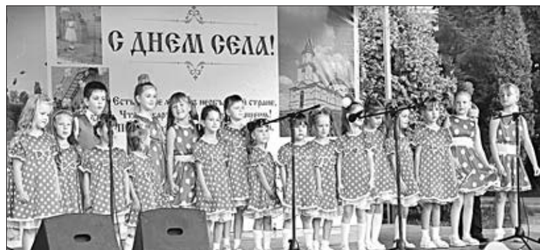
Юные дарования поселения.