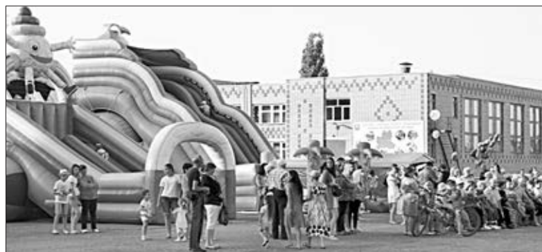
Для детворы были организованы аттракционы.