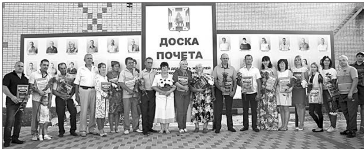
Самые активные жители Пищулинского поселения занесены на Доску почета.