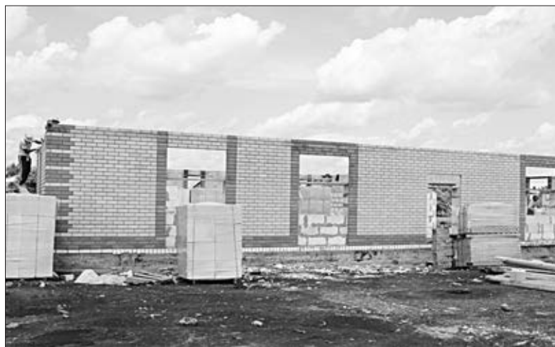
На площадке в Лавах, где возводится новый ДК, продолжаются работы.