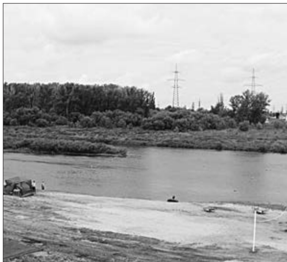
На оборудованном пляже близ Казинки можно отдохнуть всей семьей.