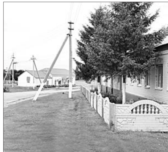
Многим улицам Казинки недостает цветников, уголков отдыха.