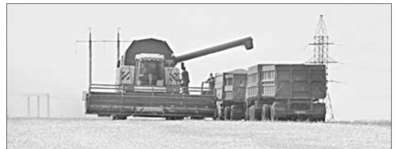
➔ 3 стр. Идет погрузка зерна.

Пятый год молодой специалист участвует в такой ответственной кампании, понимая всю серьезность своих обязанностей.