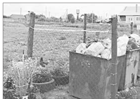
На фото справа: рядом с площадкой ТКО разбит цветник, также здесь регулярно поддерживается порядок.