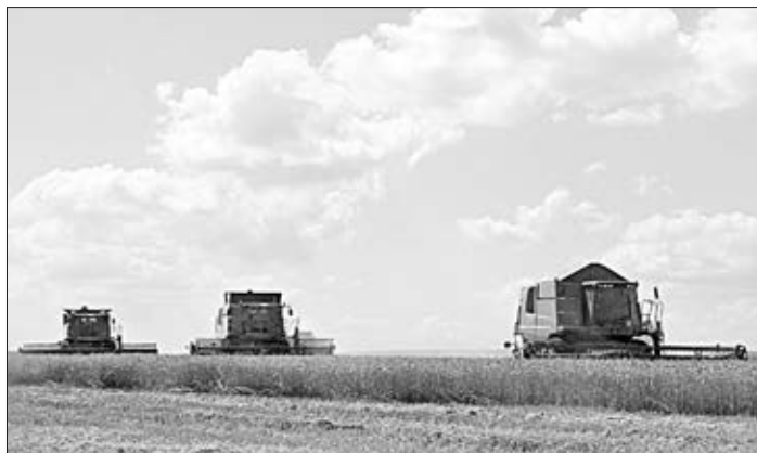
Хлеба выдались тучные.