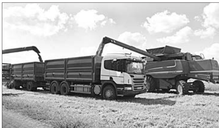
Идет загрузка зерна.