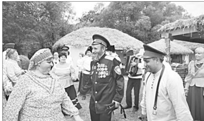
Любо! Красивой песне, зажигательному танцу в станице Новоказачьей.