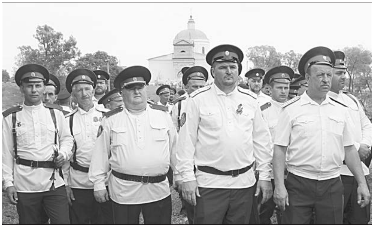
Казачество — оплот России, оплот села Казаки. Они славны своими добрыми делами, которые вершат ради процветания родной земли.