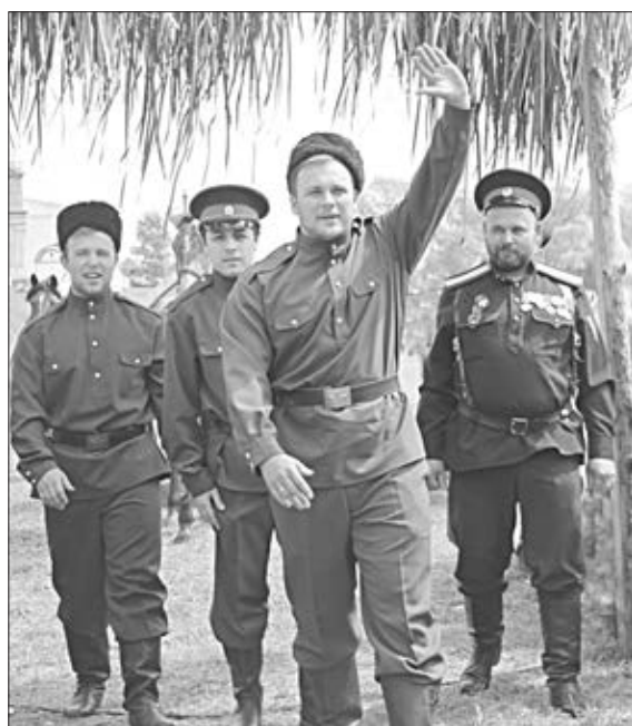
Любо, братцы, любо!

Самый красивый обряд — свадебный — разыграли в станице Веселянская. Сваты, разряженный жених и сотоварищи веселой гурьбой въезжают на бричке в просторный