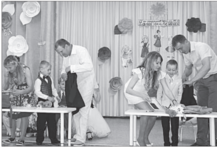
РОДИТЕЛИ УСПЕШНО СПРАВИЛИСЬ С КОНКУРСАМИ.