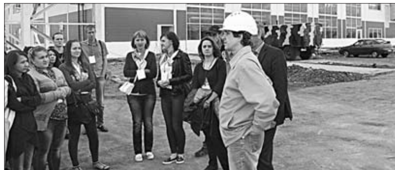
ЭКСПУРСИЯ ПО ТЕРРИТОРИИ СТРОЯЩЕГОСЯ ЗАВОДА ПО ПРОИЗВОДСТВУ ДРОЖЖЕЙ.