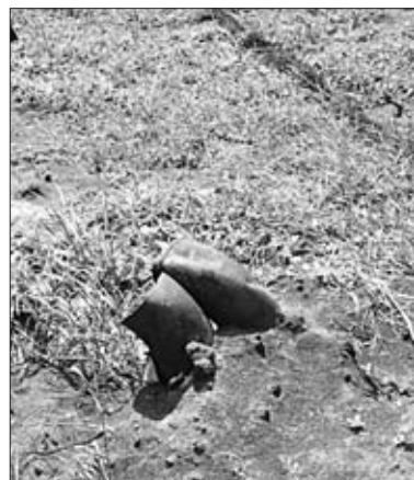
ТОРЧАЩИЕ ИЗ ЗЕМЛИ ТРУБЫ ПОРТЯТ ВИД СЕЛА.

Отличный пример того, как при желании и возможностях, начав практически с нуля, можно превратить пустырь в сад, — предприятие ООО «Мельничный комплекс «Соколье». Когда-то здесь