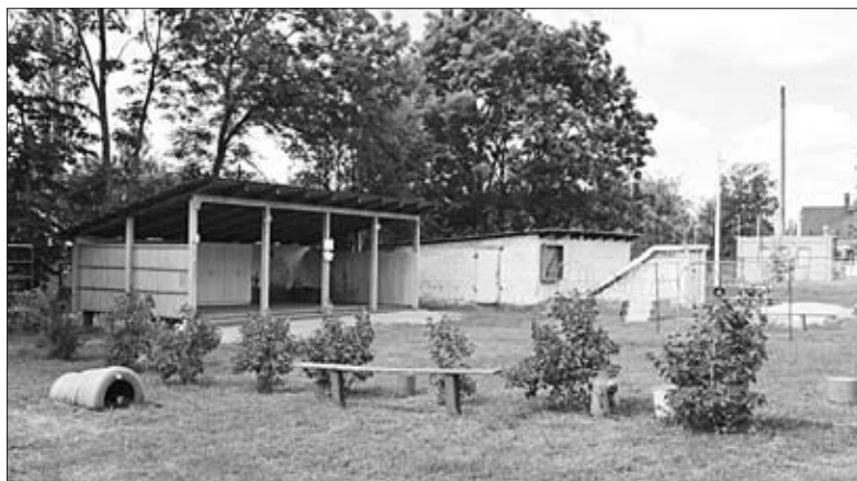
В ДЕТСКОМ САДУ ПОСЕЛКА СОКОЛЬЕ ЦАРЯТ ИДЕАЛЬНАЯ ЧИСТОТА И ПОРЯДОК.

■ Акция журналистов «В краю родном»: «Активный гражданин»