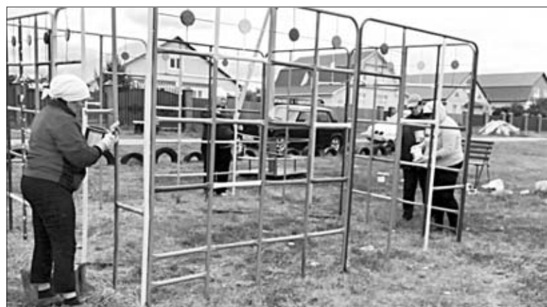
НА ДЕТСКОЙ ПЛОЩАДКЕ РАБОТЫ ХВАТИЛО И ВЗРОСЛЫМ, И ПОДРОСТКАМ.