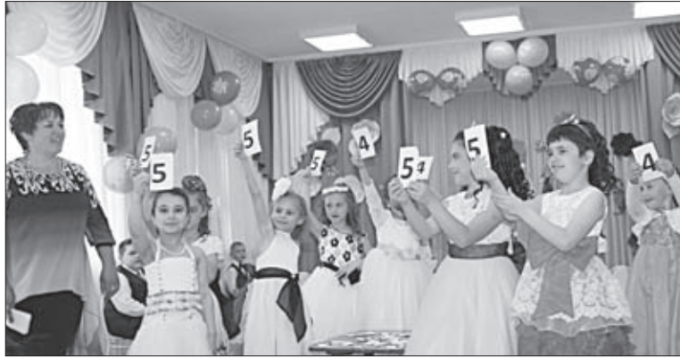
«ПЯТЕРКА» — ЛУЧШАЯ ОЦЕНКА.