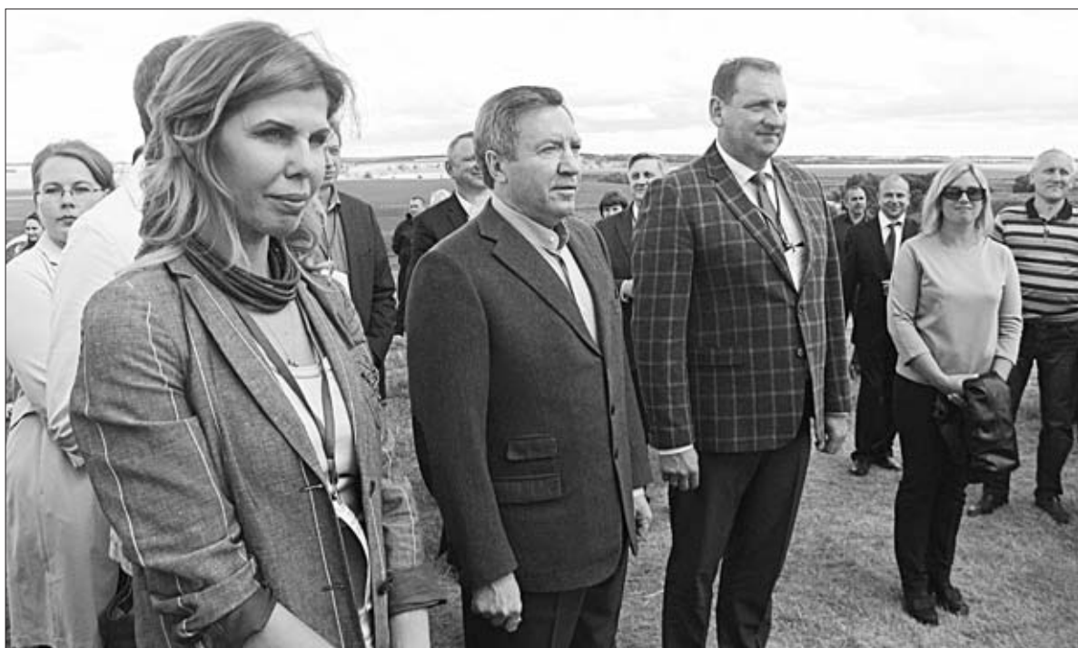
ГУБЕРНАТОР ЛИПЕЦКОЙ ОБЛАСТИ ОЛЕГ КОРОЛЕВ, ПРЕДСЕДАТЕЛЬ КОМИССИИ ОБЩЕСТВЕННОЙ ПАЛАТЫ РФ ПО ВОПРОСАМ АПК И РАЗВИТИЮ СЕЛЬСКИХ ПОСЕЛЕНИЙ ЕВГЕНИЯ УВАРКИНА И ГЛАВА ДАНКОВСКОГО РАЙОНА ВАЛЕРИЙ ФАЛЕЕВ НА ОТКРЫТИИ ВСЕРОССИЙСКОГО МОЛОДЕЖНОГО ФОРУМА.

Участники форума пообщались с программами поддержки молодежного предпринимательства в регионе, напрямую пообщались с представителями власти. Современные инструменты сельского развития. Где взять идеи, деньги, технологии? — такие темы рассмотрели на пяти тематических площадках. В рамках мероприятия были открыты экспозиции, рассказывающие об уже реализованных бизнес-проектах молодых предпринимателей. Одним из них является археологический парк «Аргамач». Гости