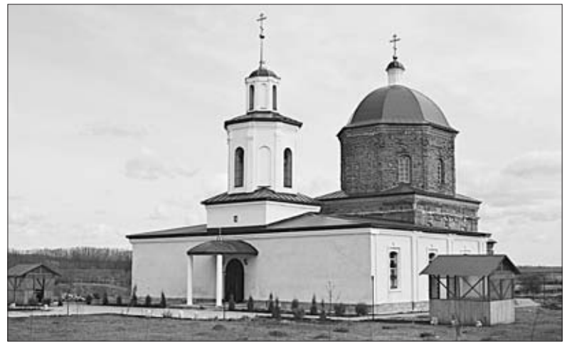
КУПОЛА ВОССТАНАВЛИВАЕМОГО ХРАМА ВИДНЫ ИЗДАЛЕКА.

Территория поселения включает в себя три населенных пункта: село Большие Извалы, деревни Екатериновка и Малые Извалы. Здесь проживает немногим более тысячи человек.