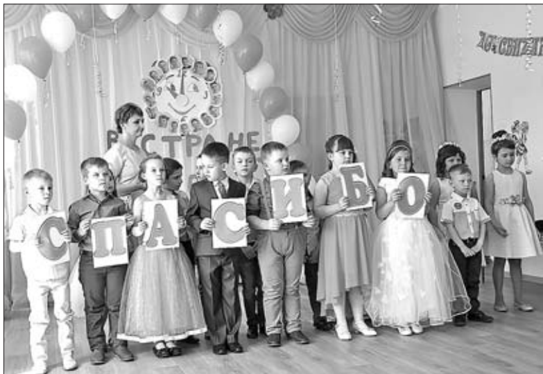
СЛОВА БЛАГОДАРНОСТИ ОТ ДОШКОЛЯТ ДЕТСКОГО САДА ПОСЕЛКА КЛЮЧ ЖИЗНИ СВОИМ ВОСПИТАТЕЛЯМ.