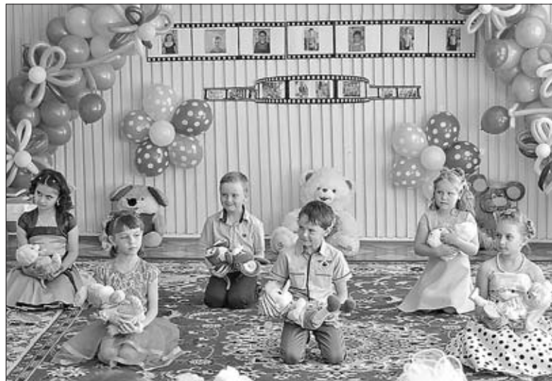
ВЫПУСКНИКИ ДОШКОЛЬНОГО УЧРЕЖДЕНИЯ СЕЛА ВОРОНЕЦ ИСПОЛНЯЮТ ТАНЕЦ С ИГРУШКАМИ.