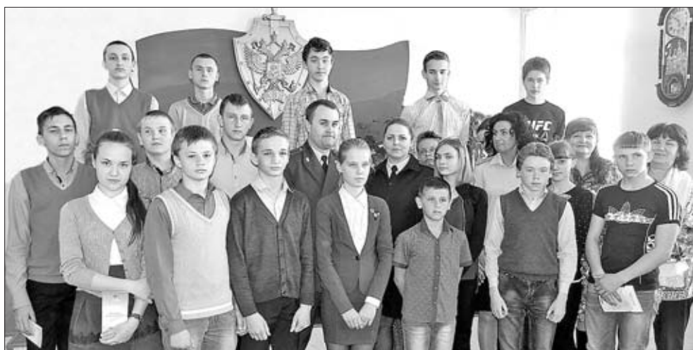
ШКОЛЬНИКИ СЕЛА ТАЛИЦА СТАЛИ УЧАСТНИКАМИ ДНЯ ОТКРЫТЫХ ДВЕРЕЙ В ОМВД РОССИИ ПО ЕЛЕЦКОМУ РАЙОНУ.

Подростки отметили, что данное мероприятие заставило их иначе взглянуть на вопрос о соблюдении прав и обязанностей несовершеннолетними. (Соб. инф.)