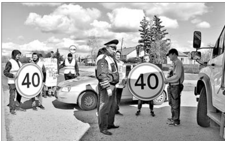
УЧАСТНИКИ АКЦИИ БЕСЕДУЮТ С ВОДИТЕЛЯМИ.

МРЭО ГИБДД УМВД России по Липецкой области напоминает: вся информация о наименованиях подразделений, предоставляемых государственных услугах, адресах, контактных телефонах, а также реквизитах для уплаты государственной пошлины размещена на Едином портале государственных и муниципальных услуг www.gosuslugi.ru и официальном портале Госавтоинспекции МВД России www.gibdd.ru . Пользуясь возможностями портала www.gosuslugi.ru , вы сами выбираете день и время, в которое вам удобно получить или заменить водительское удостоверение, поставить на учет автомобиль.