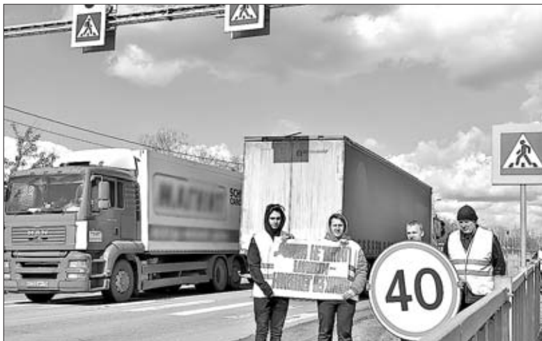
ПЛАКАТЫ И ДОРОЖНЫЕ ЗНАКИ — ДЛЯ ПРИВЛЕЧЕНИЯ ВНИМАНИЯ АВТОМОБИЛИСТОВ.