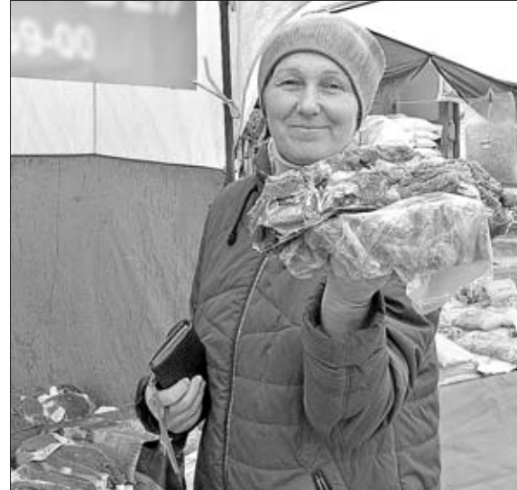
ОБЛАСТНОЙ РОЗНИЧНОЙ ЯРМАРКОЙ ОСТАЛИСЬ ДОВОЛЬНЫ И ПРОДАВЦЫ, И ПОКУПАТЕЛИ.