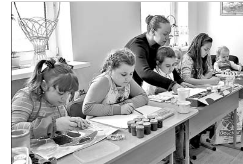
НА ЗАНЯТИЯХ В СЕМЕЙНОЙ СТУДИИ ДЕТЯМ ВСЕГДА ИНТЕРЕСНО.