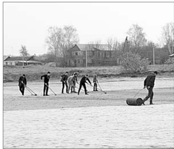
БЛАГОУСТРАИВАТЬ СТАДИОН ПОМОГАЛИ ШКОЛЬНИКИ СЕЛА ЧЕРКАССЫ.

Подготовили А. Митусова, И. Таравкова.