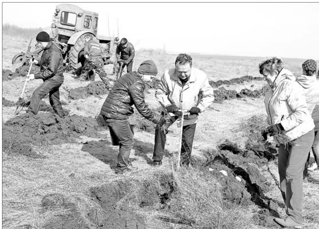
ПОСАДКУ ЛЕСА ВЕДУТ ДЕПУТАТЫ РАЙОННОГО СОВЕТА.