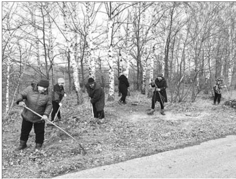
ЕЩЕ ОДИН УГОЛОК БЛИЗ ТАЛИЦЫ СТАЛ ЧИЩЕ.

Кстати, с нерадивых спрос строгий. В 2016-м, к примеру, административная комиссия района выдала предписания (о необходимости устранения нарушений правил благоустройства и санитарного состояния территорий) 34 местным жителям. Большинство поспешили навести порядок, в противном случае пришлось бы платить штраф. Такой контроль будет и в нынешнем году. Значит, о благоустройстве заботиться надо ежедневно.