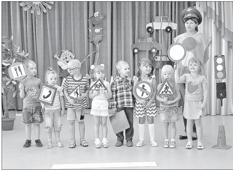
«ГОРОД ДОРОЖНЫХ ЗНАКОВ» В ДЕТСАДУ ПОСЕЛКА СОЛИДАРНОСТЬ.

Представление прошло весело. Хотелось бы надеяться, что малыши