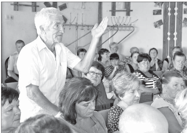
РАЗГОВОР НА СХОДЕ НИКОГО НЕ ОСТАВИЛ РАВНОДУШНЫМ.