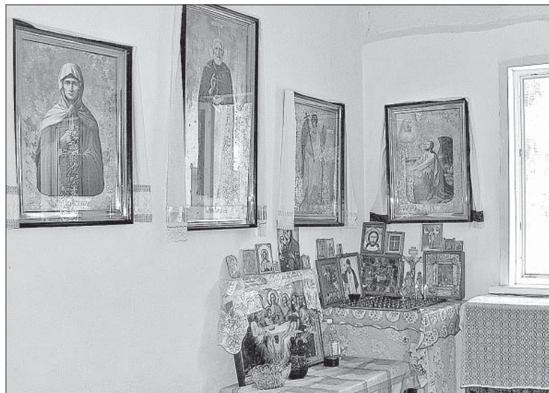
ВНУТРЕННЕЕ УБРАНСТВО ХРАМА.