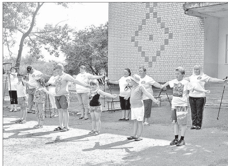
В ДНЕ ЗДОРОВЬЯ УЧАСТВОВАЛИ ЖИТЕЛИ МАЛОБОЕВСКОГО ПОСЕЛЕНИЯ РАЗНОГО ВОЗРАСТА. ВСЕМ БЫЛО ВЕСЕЛО И ИНТЕРЕСНО.