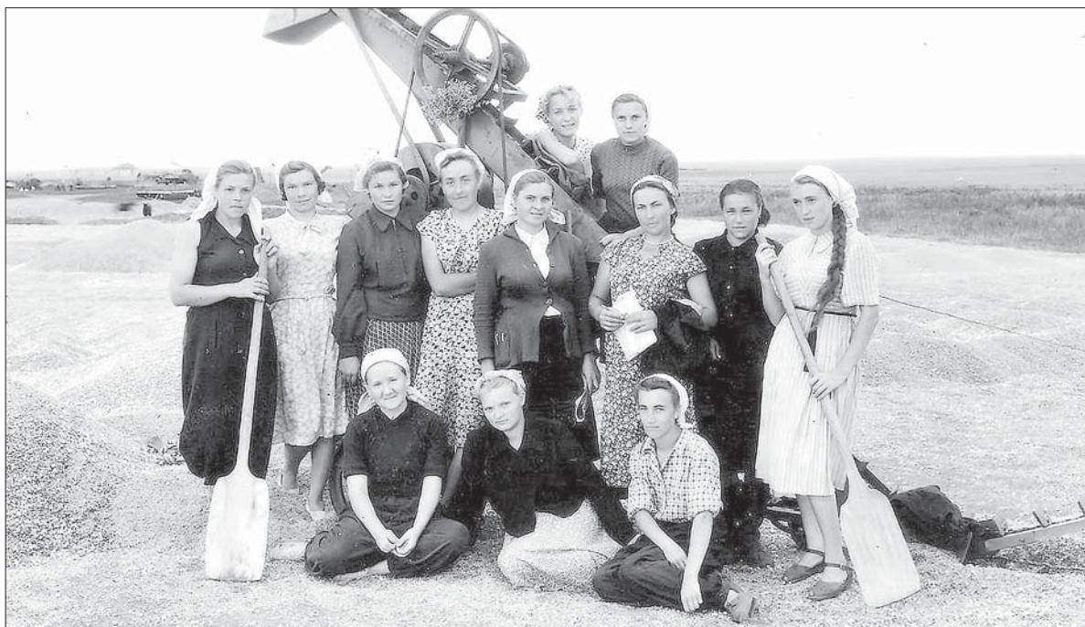
С ПОДРУГАМИ НА ЦЕЛИНЕ УБИРАЛИ ЗЕРНО.