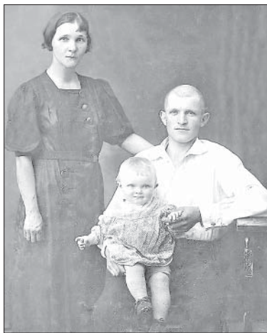
Я И МОИ РОДИТЕЛИ.

выводить (об этом много раз позже рассказывала мама) и под дулом автомата требовали назвать имена партизан. Так чуть не расстреляли отца мамы, нашего дедушку, который жил с нами. Зашумели женщины: «Какой он партизан? Он уже старик!». Ему тогда было 72 года.