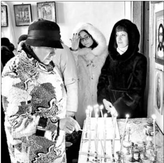
ВО ВРЕМЯ СЛУЖБЫ В ХРАМЕ ПОКРОВА ПРЕСВЯТОЙ БОГОРОДИЦЫ.

Первая пожелала хорошего отдыха, насладиться выступлениями самодельных артистов, поучаствовать в конкурсах, поводить хорооводы, покататься на лошадях.