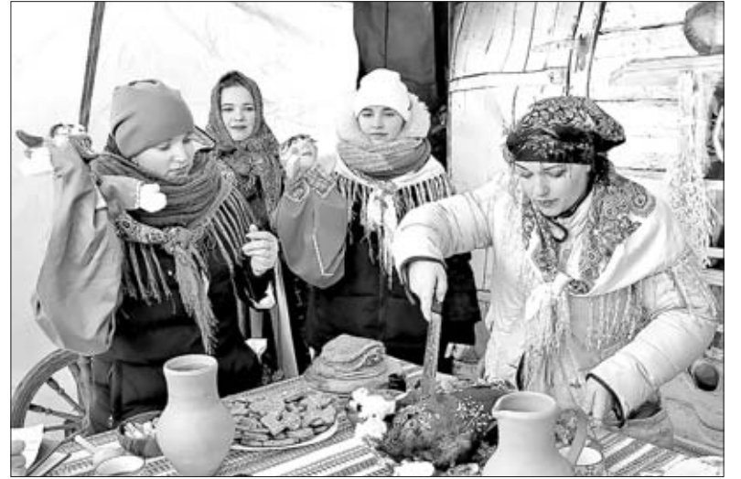
РОЖДЕСТВЕНСКИЙ ГУСЬ У АРХАНГЕЛЬЦЕВ — УДАЛСЯ.