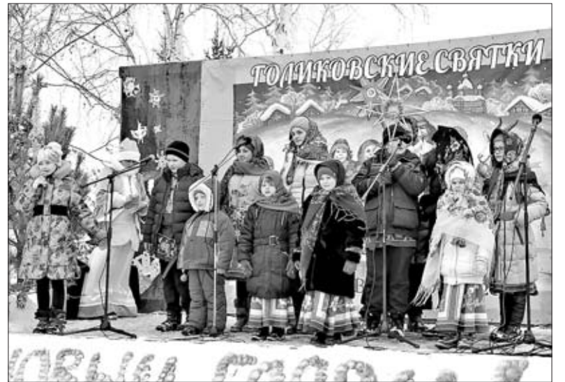
НА СЦЕНЕ — АРТИСТЫ ИЗ ФЕДОРОВСКОГО ПОСЕЛЕНИЯ.

Все без исключения готовили угощение с большим старанием и особой любовью.