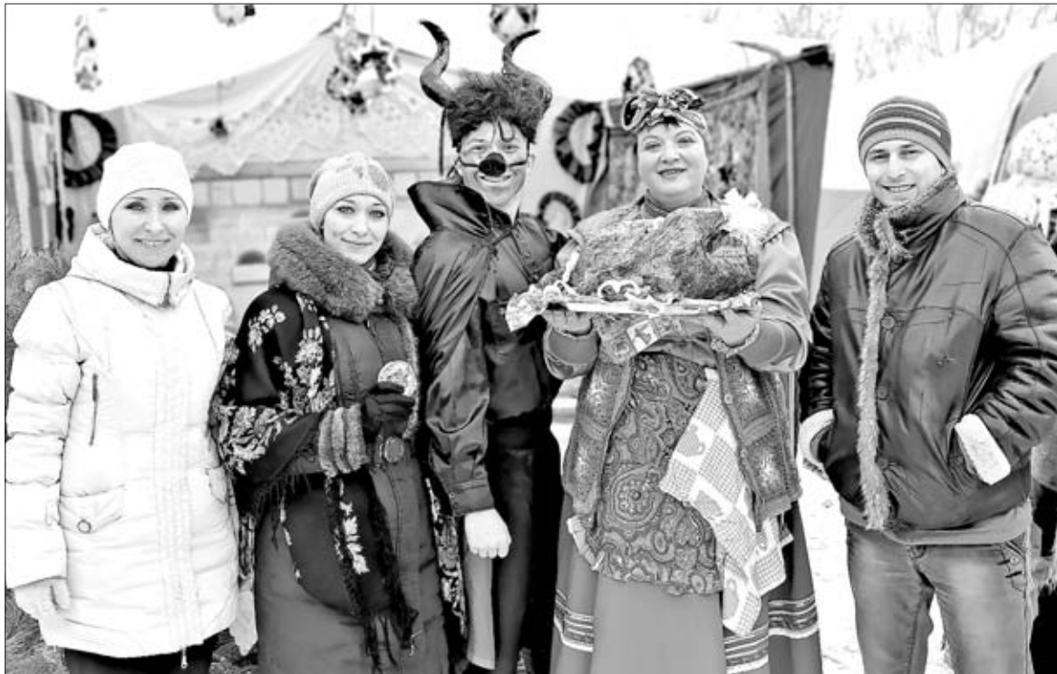
АБСОЛЮТНЫЕ ПОБЕДИТЕЛИ ФЕСТИВАЛЯ «ГОЛИКОВСКИЕ СВЯТКИ» — АРТИСТЫ ИЗ КАЗАЦКОГО СЕЛЬСКОГО ПОСЕЛЕНИЯ. САМУЮ КОЛОРИТНУЮ СОЛОХУ И САМЫЕ ЗАДОРНЫЕ КОЛЯДКИ ПРИВЕЗЛИ ИЗ КАЗАКОВ.