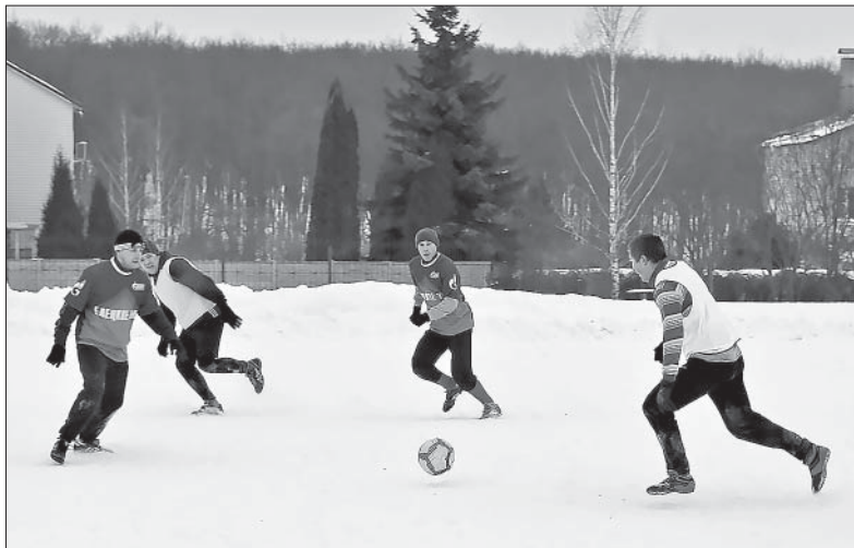
ФУТБОЛ — ИГРА ВНЕ ВРЕМЕНИ ГОДА.