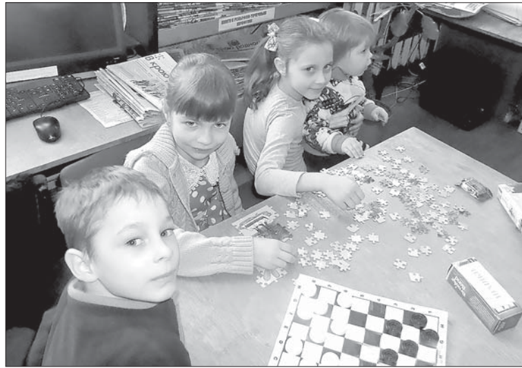
ЮНЫЕ ЧИТАТЕЛИ С ПОЛЬЗОЙ ПРОВЕЛИ НОВОГОДНИЕ КАНИКУЛЫ.