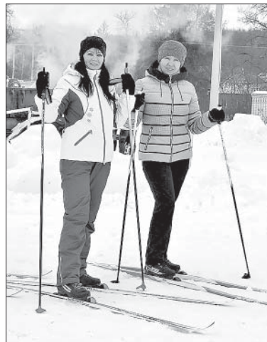
НА ЛЫЖЕ ПРЕДСТАВИТЕЛИ МЕСТНЫХ ДЕТСКИХ САДОВ.