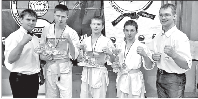
НОВЫЕ ЧЕМПИОНЫ РАЙОННОГО СПОРТИВНОГО КЛУБА «ФЕНИКС».