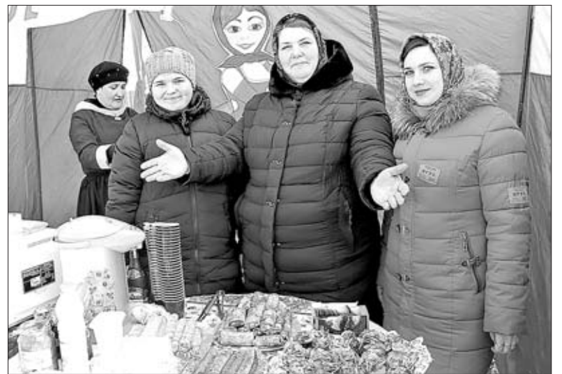
ГОСТЕЙ ЗА ПРАЗДНИЧНЫЙ СТОЛ ЗАЗЫВАЛИ ХОЗЯЕВА — ЕЛЕЦКОЕ ПОСЕЛЕНИЕ.