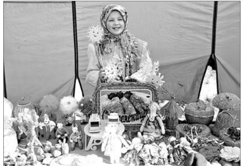
ДЕТВОРЕ И ВЗРОСЛЫМ ИГРУШКИ РУЧНОЙ РАБОТЫ ПРЕДЛАГАЛ ЦЕНТР ДОПОЛНИТЕЛЬНОГО ОБРАЗОВАНИЯ.