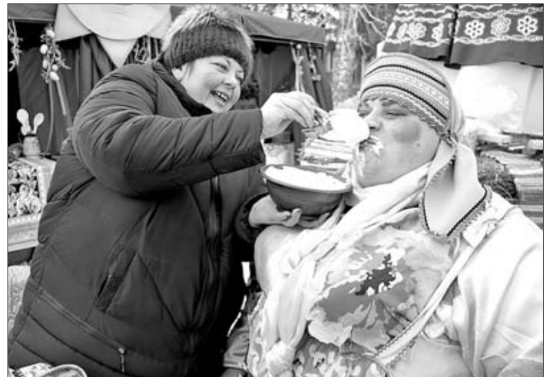
ХОРОШИ БЛИНЫ, ДА СО СМЕТАНОЙ. ВОТ ТАК АППЕТИТ!

Самый ажурный блин испекли в Волчанском поселении, а тонкий — в Елецком, оригинальный — в Малобоевском... Награды за лучшую