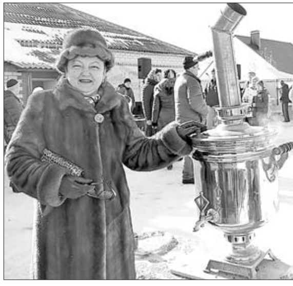
ЧАЙ ИЗ САМОВАРА И БОДРИТ, И ЗДОРОВЬЕ УМНОЖАЕТ.