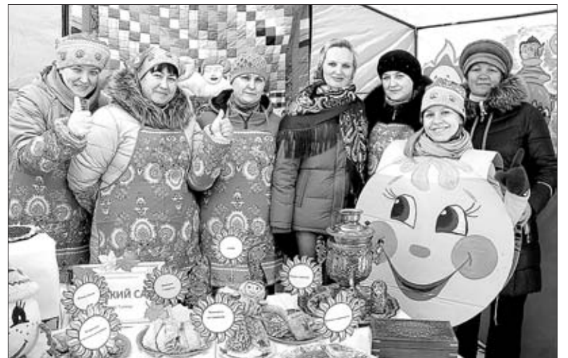
РАБОТНИКИ ДЕТСКОГО САДА СЕЛА ТАЛИЦА ПРЕДСТАВЛЯЮТ СВОИ БЛИНЫ.

блинную композицию удостоена Пищулинская сельская территория.