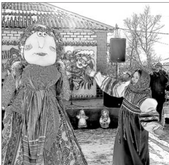
ВОТ ТАК МАСЛЕНА!