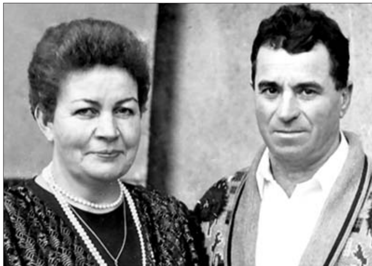
СУПРУГИ МОРОЗОВЫ.

Казалось, ничто не могло вывести ее из состояния безысходности — ни уговоры мужа, ни взрослых дочерей. Но только мама