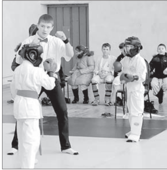
ЮНЫЕ СПОРТСМЕНЫ ТУРНИРА ПО РУКОПАШНОМУ БОЮ.