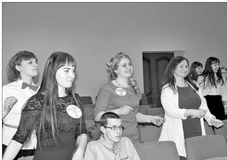
ВЕСЕЛАЯ ЗАРЯДКА ДЛЯ ЗРИТЕЛЕЙ.