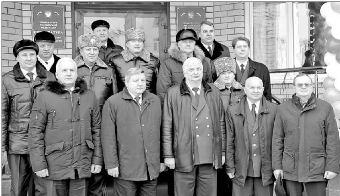
ФОТО НА ПАМЯТЬ У ЗДАНИЯ ПРОКУРАТУРЫ.