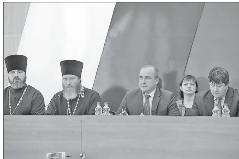
ИДЕТ ЗАСЕДАНИЕ «КРУГЛОГО СТОЛА».