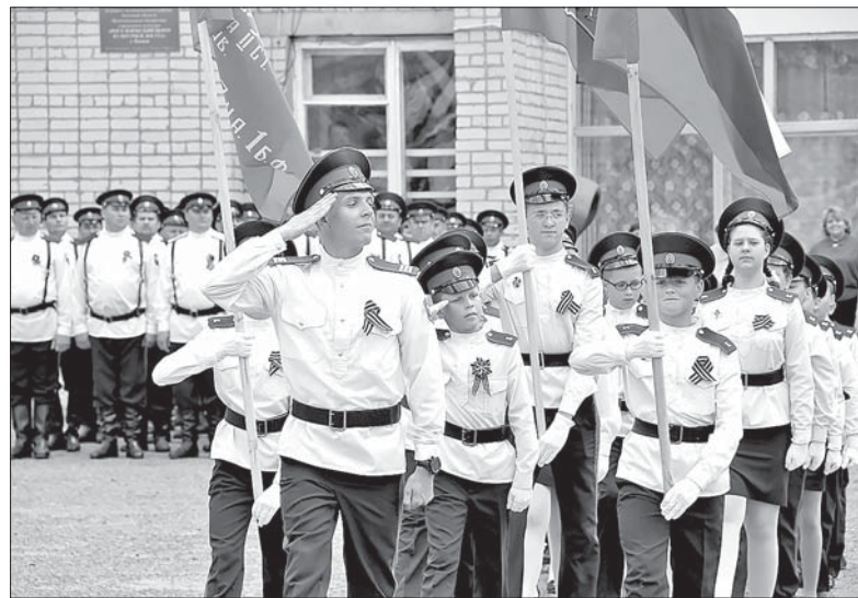
КАДЕТЫ ХРАНЯТ ДУХОВНОЕ И КУЛЬТУРНОЕ НАСЛЕДИЕ КАЗАЧЕСТВА.