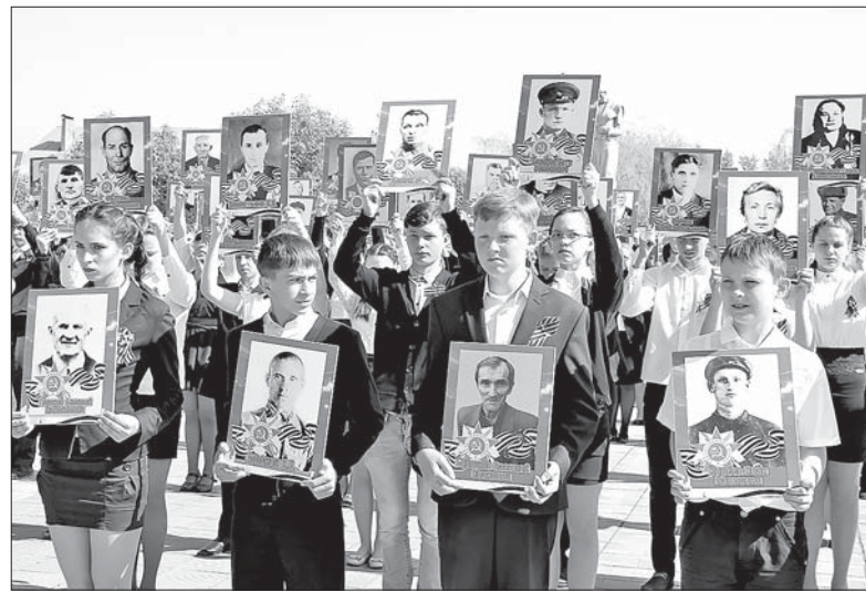
ШКОЛЬНИКИ ВСЕГДА УЧАСТВУЮТ В ПОСТРОЕНИИ «БЕССМЕРТНОГО ПОЛКА».