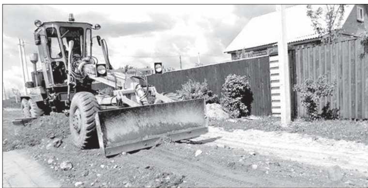
Подготовила А. МИТУСОВА.

— Надо отметить, что дорожная деятельность остается на контроле в