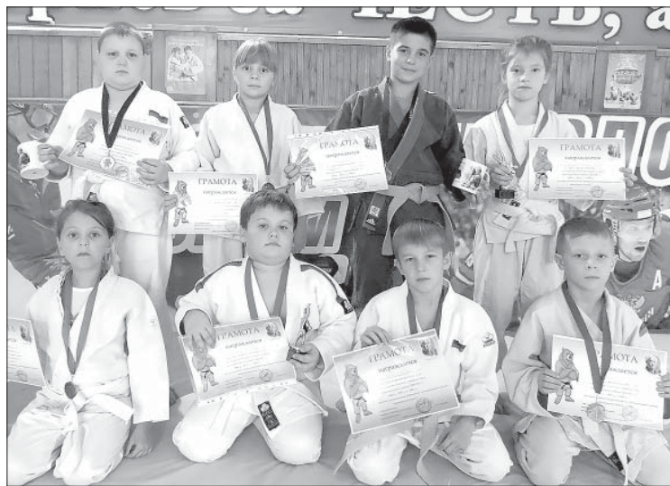
ВОСПИТАННИКИ РАЙОННОЙ ДЮСШ С НАГРАДАМИ ВСЕРОССИЙСКОГО ТУРНИРА.

Более 600 спортсменов из разных регионов страны в течение двух дней оспаривали первенство на Всероссийском турнире по дзюдо (в городе Боброве Воронежской области). Юные воспитанники районной ДЮСШ не затерялись, а доказали, что елецкая школа борьбы имеет свой стиль, является одной из опытных в ЦФО.