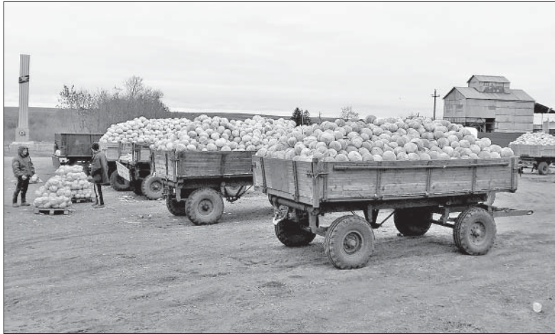
КАПУСТА НЫНЕ УРОДИЛАСЬ.