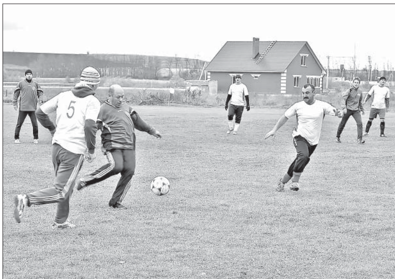
ВETERАНЫ «МАЕВКИ» В ИГРЕ С «АВАНГАРДОМ» ОКАЗАЛИСЬ УДАЧЛИВБЕЕ.