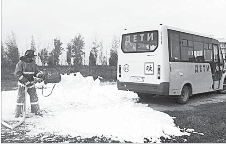
СПАСАТЕЛИ ОДНИМИ ИЗ ПЕРВЫХ НАЧИНАЮТ ДЕЙСТВОВАТЬ В СЛУЧАЕ ВОЗНИКНОВЕНИЯ ЧС.