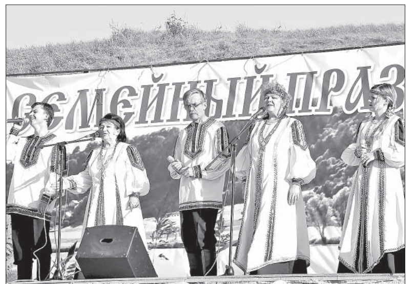
НА СЕМЕЙНОМ ПРАЗДНИКЕ, КОТОРЫЙ ПРОХОДИЛ В КАЗИНКЕ, ВОКАЛИСТЫ НАРОДНОГО АНСАМБЛЯ «ОКОЛИЦА» В ОЧЕРЕДНОЙ РАЗ ПОРАДОВАЛИ СЕЛЯН ПЕСНЕЙ.

Впервые они заявили о себе всерьез в 2005 году. Участие в 6-м Всероссийском фестивале народного творчества «Ты, Россия, и сердце, и песня моя» им. А. П. Мистюкова, где коллектив завоевал Гран-при в номинации «Ансамбли народной песни». А спустя 10 лет — Международный фестиваль исполнителей патриотической песни «И помнит мир спасенный!» в Твери, в котором «Околица» стала Лауреатом I степени. Всех достижений и регалий не перечислить. В ДК п. Солидарность хранятся дипломы, благодарности. Важная деталь: участвуя в событийных мероприятиях и фестивалях, народный вокальный ансамбль «Околица» всегда становился лауреатом. Это говорит о мастерстве и профессионализме его участников.