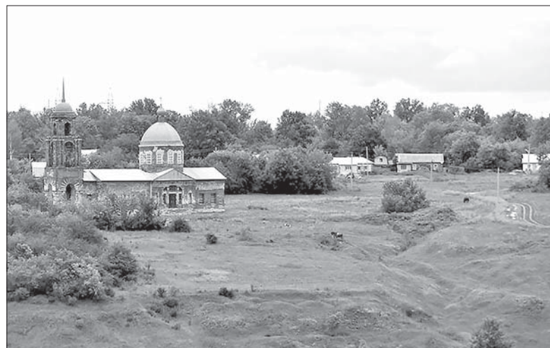
ХРАМ — НАСТОЯЩЕЕ УКРАШЕНИЕ СЕЛА НИЖНИЙ ВОРГОЛ.