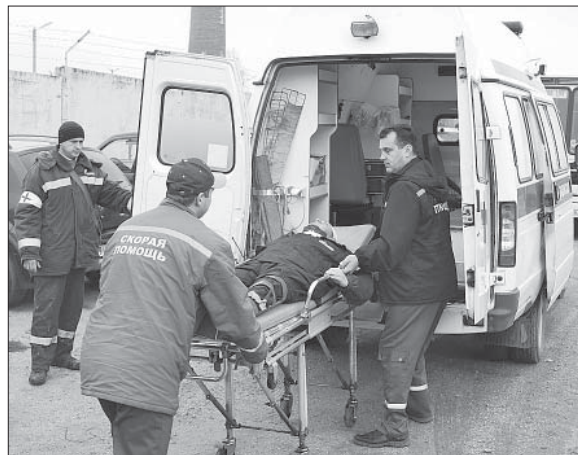
ПОМОЩЬ ПРИШЛА ВОВРЕМЯ.