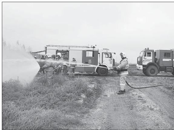
В СЧИТАННЫЕ МИНУТЫ ПОЖАРНЫЕ РАСЧЕТЫ ПРИСТУПИЛИ К ЛИКВИДАЦИИ ЧС.