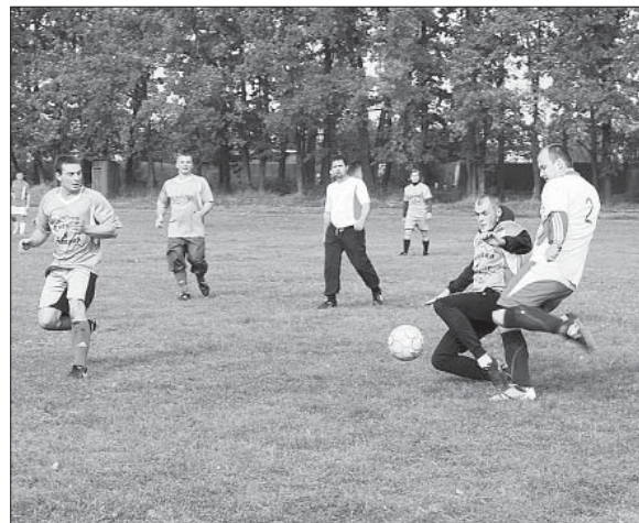
НА ПОЛЕ ЧЕМПИОНЫ РАЙОНА НИЖНЕВОРГОЛЬЦЫ И СЕРЕБРЯНЫЕ ПРИЗЕРЫ СОРЕВНОВАНИЙ — КОМАНДА «АВАНГАРД».