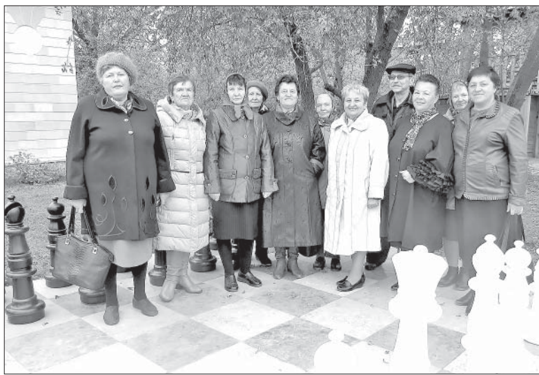
КЛУБ ПОЖИЛЫХ ЛЮДЕЙ И ИНВАЛИДОВ «ЗАВАЛИНКА». ФОТО НА ПАМЯТЬ.

Во второй половине XIX века отставной генерал от инфантерии Муравьев-Карский поселился в усадьбе, занялся хозяйствованием. На территории был