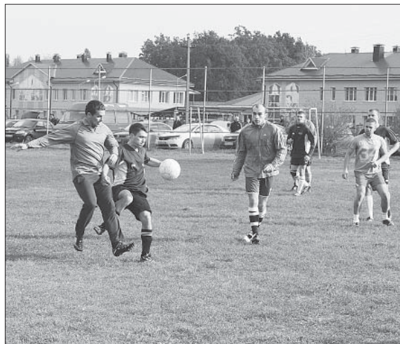
СБОРНЫЕ КАЗАЦКОГО И ВОРОНЕЦКОГО ПОСЕЛЕНИЙ СЫГРАЛИ ПЕРВЫЙ МАТЧ КУБКА ЗАКРЫТИЯ СЕЗОНА.