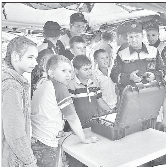
БЛАГОДАРЯ РОБОТУ «ГНОМ» НА МОНИТОРЕ МОЖНО УВИДЕТЬ ДНО БЫСТРОЙ СОСНЫ.