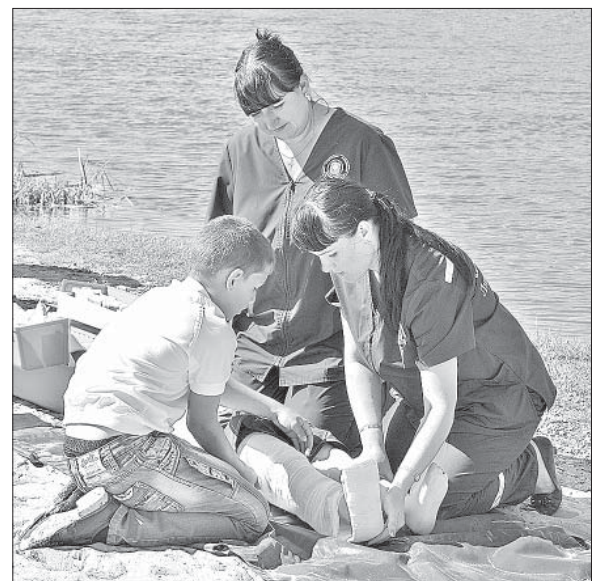
УРОКИ ПЕРВОЙ ПОМОЩИ ОТ МЕДРАБОТНИКОВ УПРАВЛЕНИЯ МЧС.