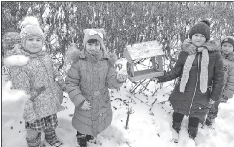
ВОСПИТАННИКИ ДЕТСКОГО САДА ПОСЕЛКА ЕЛЕЦКИЙ НЕ ПРОЧЬ ПОМОЧЬ ПЕРНАТЫМ.