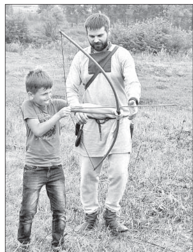
СТРЕЛЯТЬ ИЗ ЛУКА НЕПРОСТО.