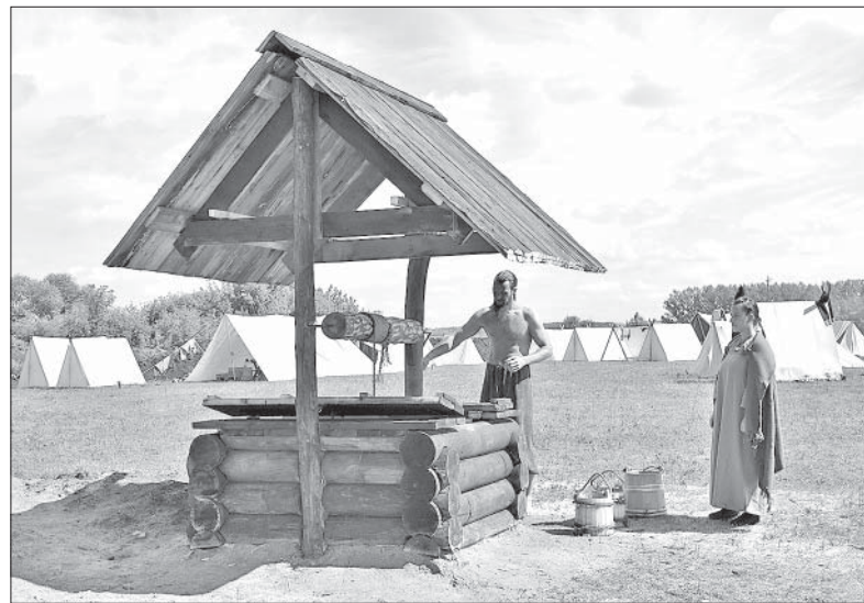
В ЛАГЕРЕ РЕКОНСТРУКТОРОВ ТЕПЕРЬ ЕСТЬ СВОЙ КОЛОДЕЦ.

обладают недюжинными. Однако удача оказалась на стороне липчан.