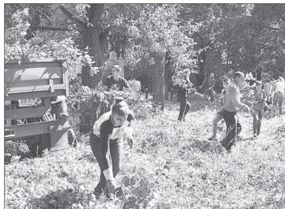
ЭКОЛОГИЧЕСКИЙ ДЕСАНТ НА РАСЧИСТКЕ ТЕРРИТОРИИ ПАРКА В ДЕРЕВНЕ ШАТАЛОВКА.