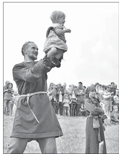
НА ФЕСТИВАЛЬ — ВСЕЙ СЕМЬЕЙ.