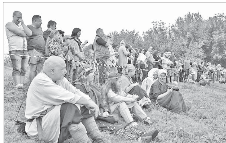
НА ФЕСТИВАЛЕ БЫЛО ИНТЕРЕСНО И УЧАСТНИКАМ, И ЗРИТЕЛЯМ.

От Владивостока до Ельца — путь неблизкий. Но разве могут расстояния стать преградой, разделить друзей, единомышленников?! Конечно, нет. Именно поэтому на ставший уже традиционным фестиваль «Ладейное поле» (он в этом году был десятым, юбилейным, и теперь получил постоянную «прописку» в Елецком районе, на площадке близ поселка Елецкий) прибыли реконструкторы из далекого Владивостока, а еще Владимира, Тамбова, Москвы, других регионов нашей страны.