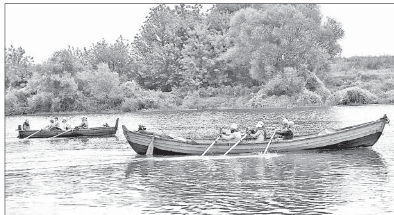
К РЕЧНОЙ РЕГАТЕ СТАРИННЫЕ ЛОДКИ ГОТОВЫ.

Порядка 300 метров должны были пройти на веслах участники регаты, половину пути — против течения. Кто это делает быстрее, тот и победитель. Реконструкторы старались вволю, силой и единством и впрямь