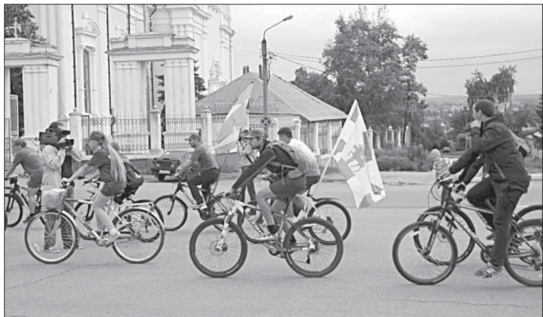
УЧАСТНИКИ ВЕЛОПРОБЕГА «ЗА ЗДОРОВОЕ БУДУЩЕЕ!» ОТПРАВИЛИСЬ ПО МАРШРУТУ ЕЛЕЦ — ЛИПЕЦК.