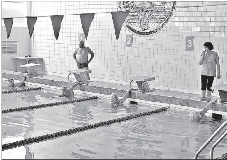
УЧАСТНИКИ СОРЕВНОВАНИЙ К СТАРТУ ГОТОВЫ.