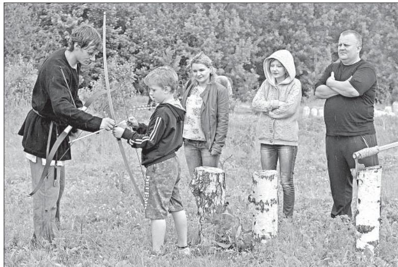
НА ФЕСТИВАЛЕ БЫЛ ОТКРЫТ ТИР ДЛЯ СТРЕЛБЫ ИЗ ЛУКА. ВСЕ ЖЕЛАЮЩИЕ МОГЛИ ПРОВЕРИТЬ СВОЮ МЕТКОСТЬ.