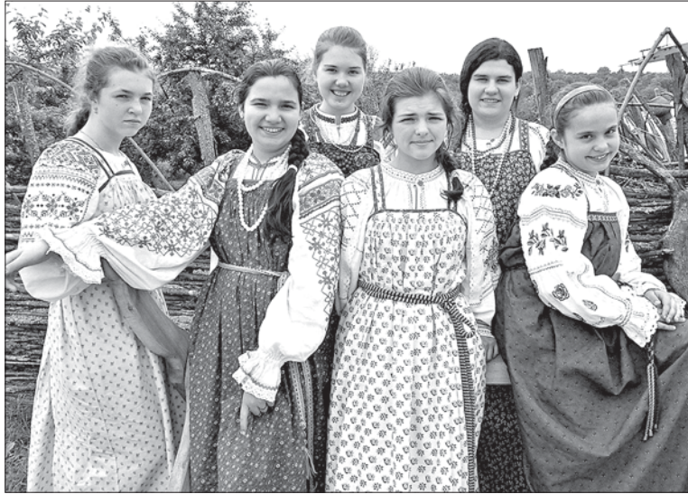
ВОСПИТАНИЦЫ ВОКАЛЬНОГО АНСАМБЛЯ «СОЛОВУШКА» СВОИМ ВЫСТУПЛЕНИЕМ НА ФЕСТИВАЛЕ ОСТАЛИСЬ ДОВОЛЬНЫМИ.