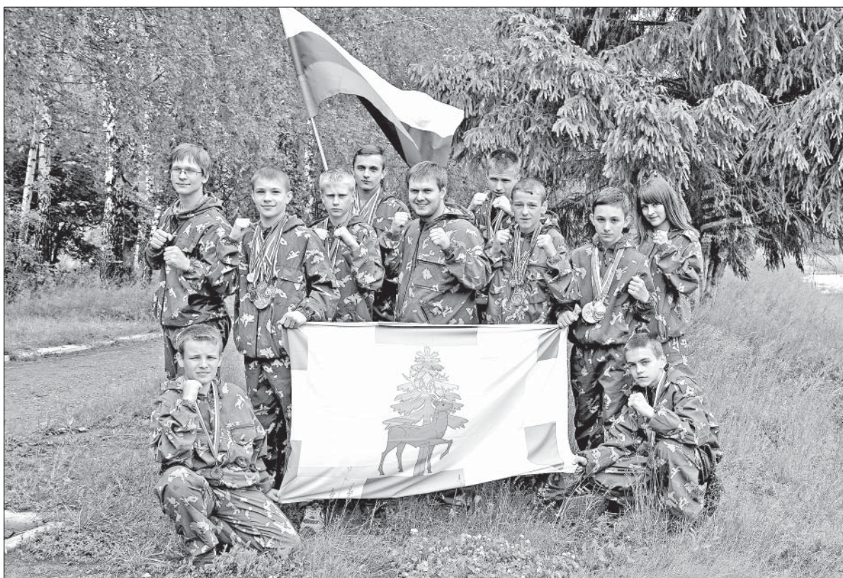
СПОРТСМЕНЫ ПРАВОСЛАВНОГО ВОЕННО-ПАТРИОТИЧЕСКОГО КЛУБА «ФЕНИКС».

С каждым годом День России все больше становится символом национального единения и общей ответственности за настоящее и будущее нашей Родины.