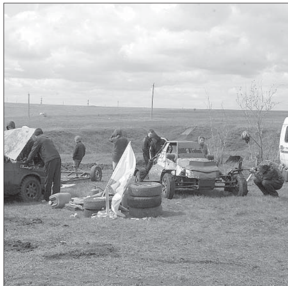
ИДЕТ ПОДГОТОВКА К СТАРТУ.