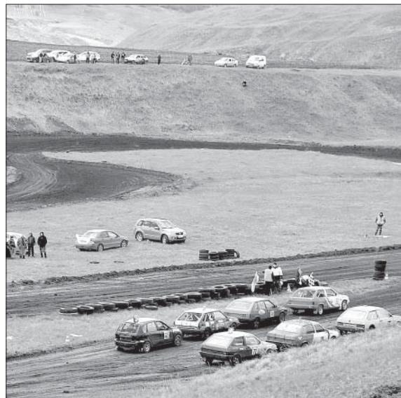
В ОЖИДАНИИ ВЫХОДА НА ДИСТАНЦИЮ.