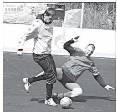
ЗА ПОБЕДУ УПОРНО БОРОЛИСЬ И ВЗРОСЛЫЕ, И ДЕТИ.