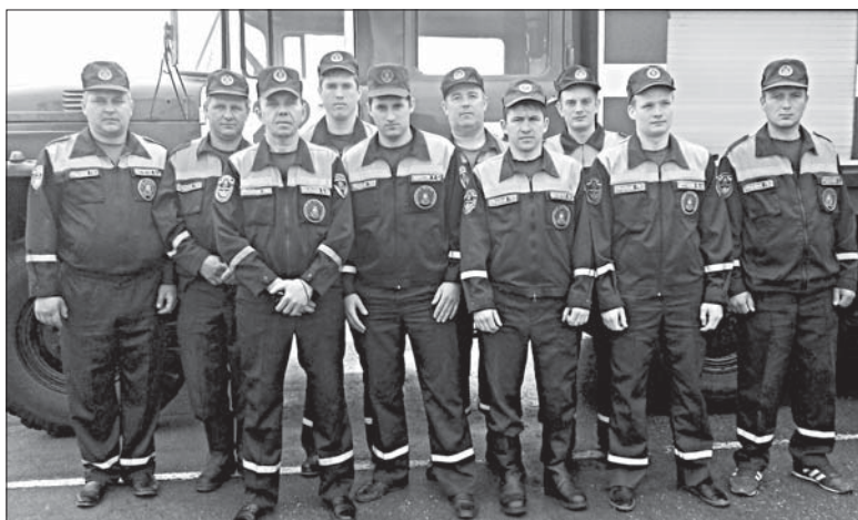
КОЛЛЕКТИВ ОПСП № 22 СЕЛА КАЗАКИ.

Кстати, сотрудники постоянно совершенствуют свою подготовку: теоретическую — в учебном классе, практическую — в тренировочном городке на территории ОПСП.