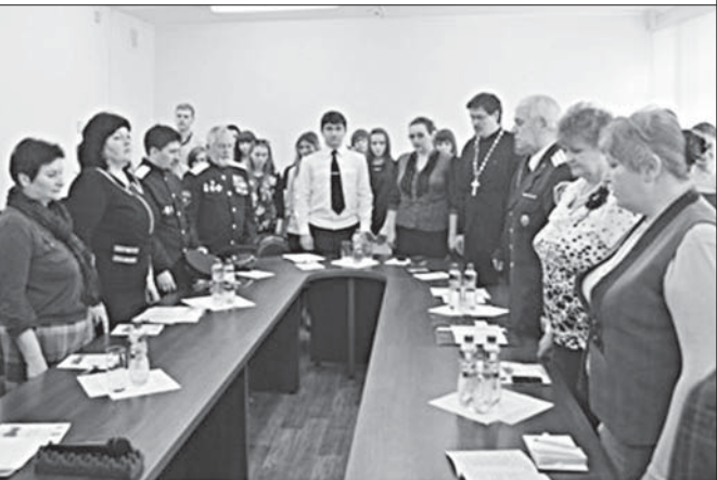
УЧАСТНИКИ КОНФЕРЕНЦИИ «СЛУЖИТЬ РОДИНЕ — ПОЧЕТНО!».