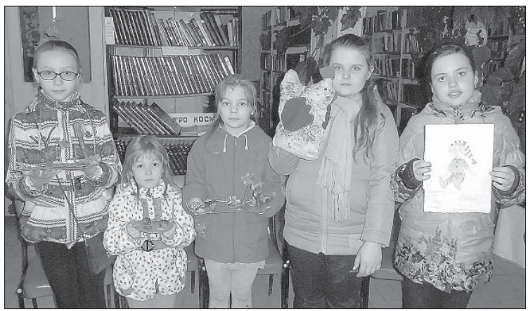
ЮНЫЕ ЧИТАТЕЛИ СО СВОИМИ ПОДЕЛКАМИ.