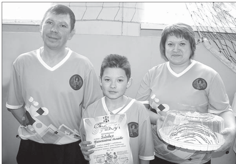
ДРУЖНАЯ СЕМЬЯ БЫКОВЫХ.