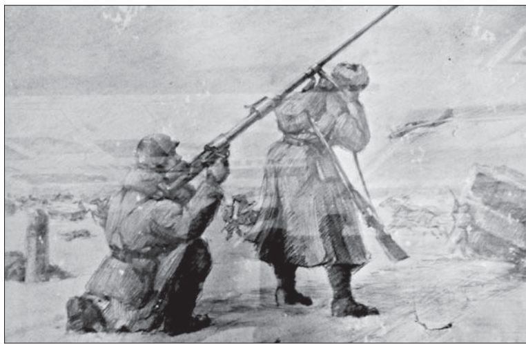
ФРОНТОВАЯ РАБОТА ХУДОЖНИКА.