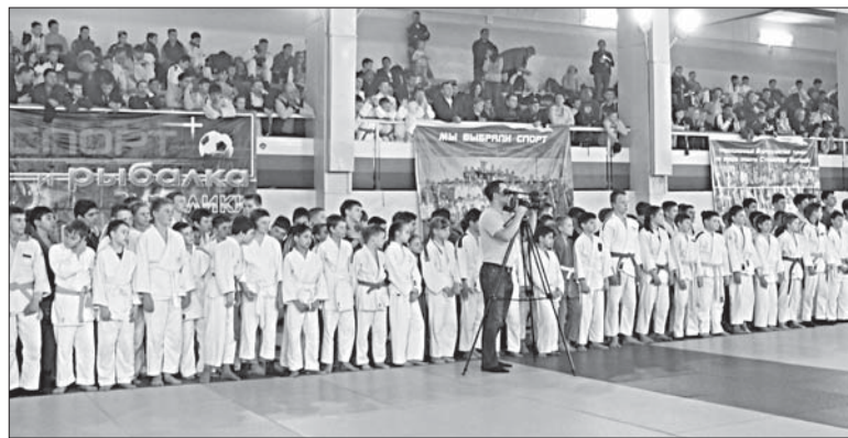
БОЛЕЕ 400 УЧАСТНИКОВ ВЫШЛИ НА ТАТАМИ.

На кубках, что вручали лучшим из лучших, были такие слова: «Уникально-му человеку, добившемуся спортивных высот, проявившему волю, характер, силу, умеющему побеждать».