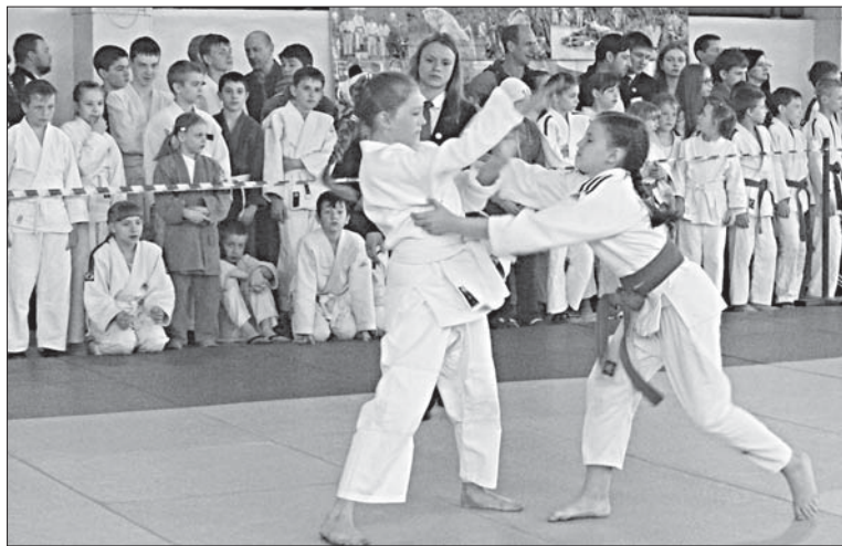
ЖЕЛАНИЕ ПОБЕДИТЬ ПРИДАЕТ СИЛ И УВЕРЕННОСТИ.