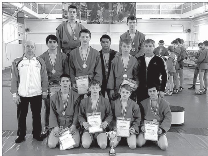
КОМАНДА ЕЛЬЧАН НА СОРЕВНОВАНИЯХ В МОЖАЙСКЕ.