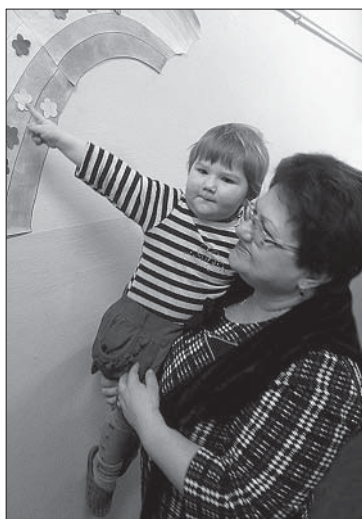
ДОТЯНУТЬСЯ ДО «РАДУГИ».

На закрытии Недели психологии воспитанники и сотрудники Центра участвовали в танцевальном флешмобе, просматривали презентацию с фотографиями «По страницам Недели психологии» и обсуждали прошедшую Неделю. Было много положительных отзывов о проделанной работе, а в целом все мероприятия для каждого имели свою ценность. Самые активные ребята отмечены