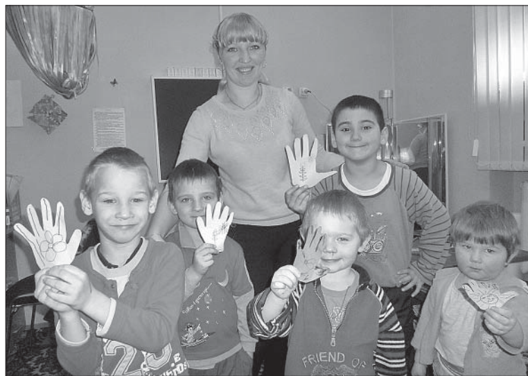
АКЦИЯ «ОСТАВЬ СВОЙ СЛЕД» ЗАИНТЕРЕСОВАЛА МАЛЫШЕЙ.