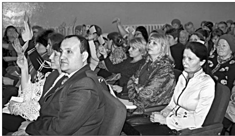
УЧАСТНИКИ РОДИТЕЛЬСКОГО СОБРАНИЯ.