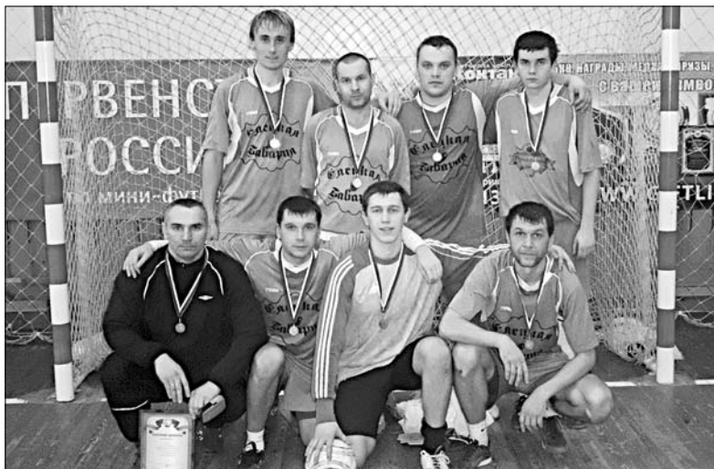
«ЕЛЕЦКАЯ БАВАРИЯ» — ПРИЗЕР ОБЛАСТНОГО ЧЕМПИОНАТА ПО МИНИ-ФУТБОЛУ.