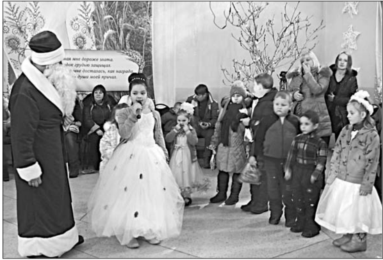
ВСТРЕЧА С ДЕДОМ МОРОЗОМ И СНЕГУРОЧКОЙ ПОДАРИЛА РАДОСТЬ ДЕТЯМ.