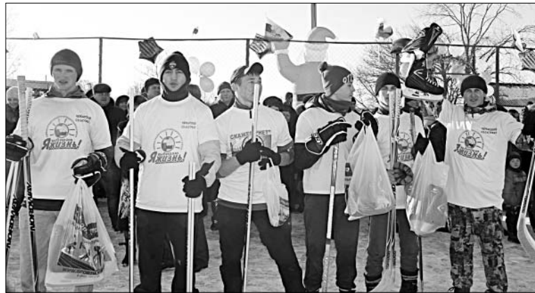
ЮНЫЕ ХОККЕИСТЫ С ПОДАРКАМИ.