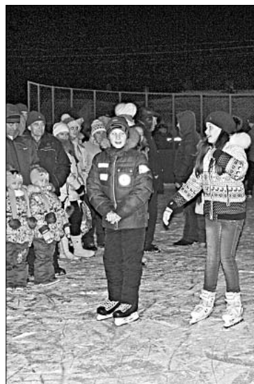
НА КАТКЕ ВСЕГДА МНОГОЛЮДНО.