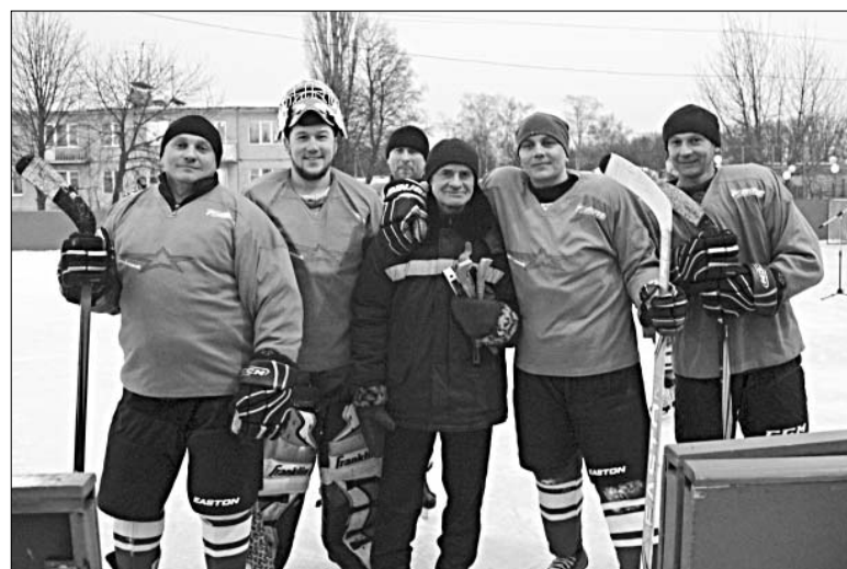
МОЛОДЕЖНЫЙ СОСТАВ И ВЕТЕРАНЫ ВСТРЕТИЛИСЬ НА ЛЬДУ В ХМЕЛИНЦЕ.