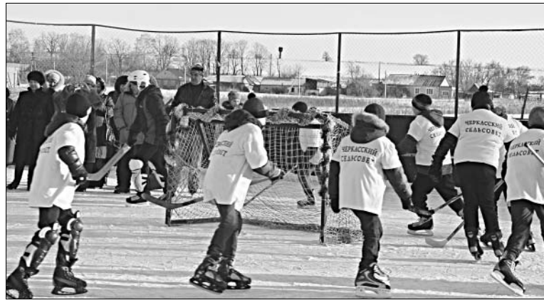
НА ЛЕД ВЫШЛА МЕСТНАЯ КОМАНДА ХОККЕИСТОВ.