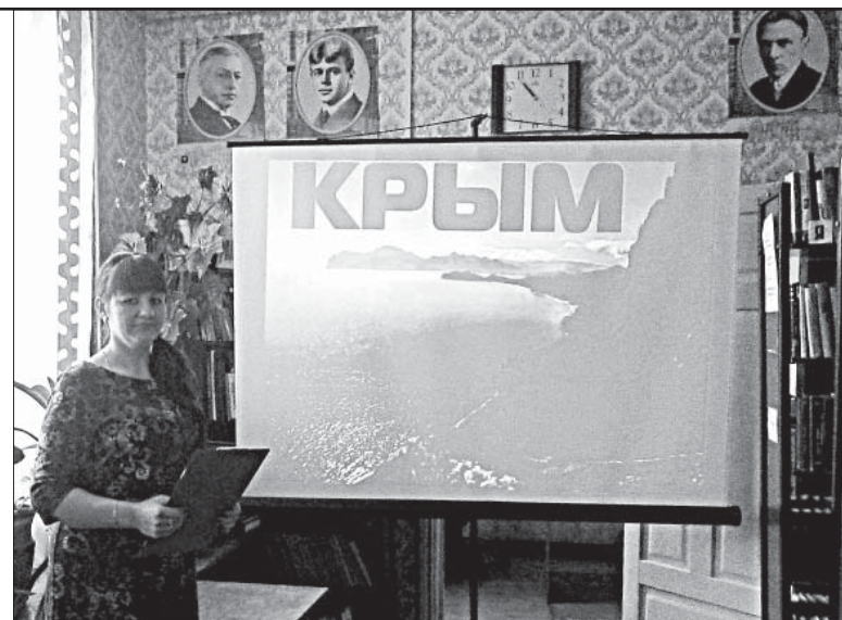
ДОКУМЕНТАЛЬНЫЙ ФИЛЬМ О КРЫМЕ ПОКАЗАЛИ РЕБЯТАМ В РАЙОННОЙ БИБЛИОТЕКЕ.

Ребята узнали об исторических событиях, происходивших в Крыму на протяжении трех столетий, познакомились с многочисленными уникальными памятниками культуры, заповедниками живой природы. Библиотекари рассказали об уникальных уголках Крыма, которые воспеты многими писателями, поэтами, художниками, не раз побывавшими в тех местах. Это А. Пушкин, М. Волошин, В. Маяковский, А. Ахматова, И. Бродский и другие. Так, Константин Паустовский писал: «Есть уголки нашей земли настолько прекрасные, что каждое посещение их вызывает ощущение счастья, жизненной полноты, настраивает все наше