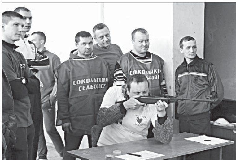
ПОРАЗИТЬ ЦЕЛЬ БЫЛО ДОВЕРЕНО САМЫМ МЕТКИМ СТРЕЛКАМ.