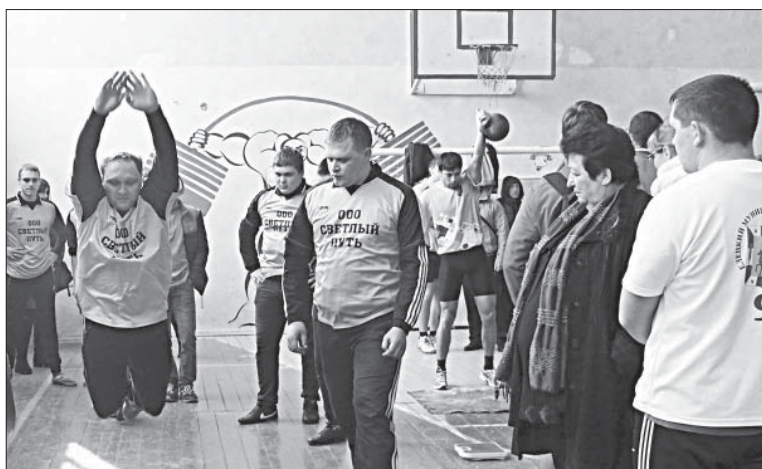
В ПРЫЖКАХ В ДЛИНУ БЫЛ ВАЖЕН КОМАНДНЫЙ РЕЗУЛЬТАТ.