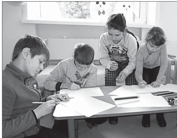
СОТРУДНИКИ РАЙОННОЙ БОЛЬНИЦЫ ОРГАНИЗОВАЛИ ДЛЯ РЕБЯТ ИНТЕРЕСНЫЕ КОНКУРСЫ.